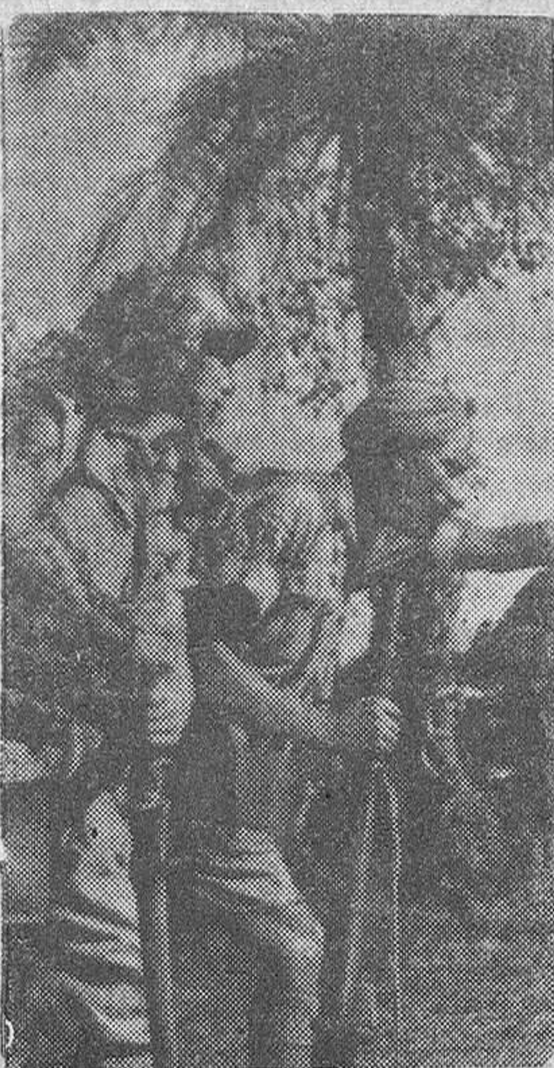
Un soldado del ejército japonés combatiendo al lado de un camarada indio. La aguda vista del indio busca al enemigo oculto en la jungla.