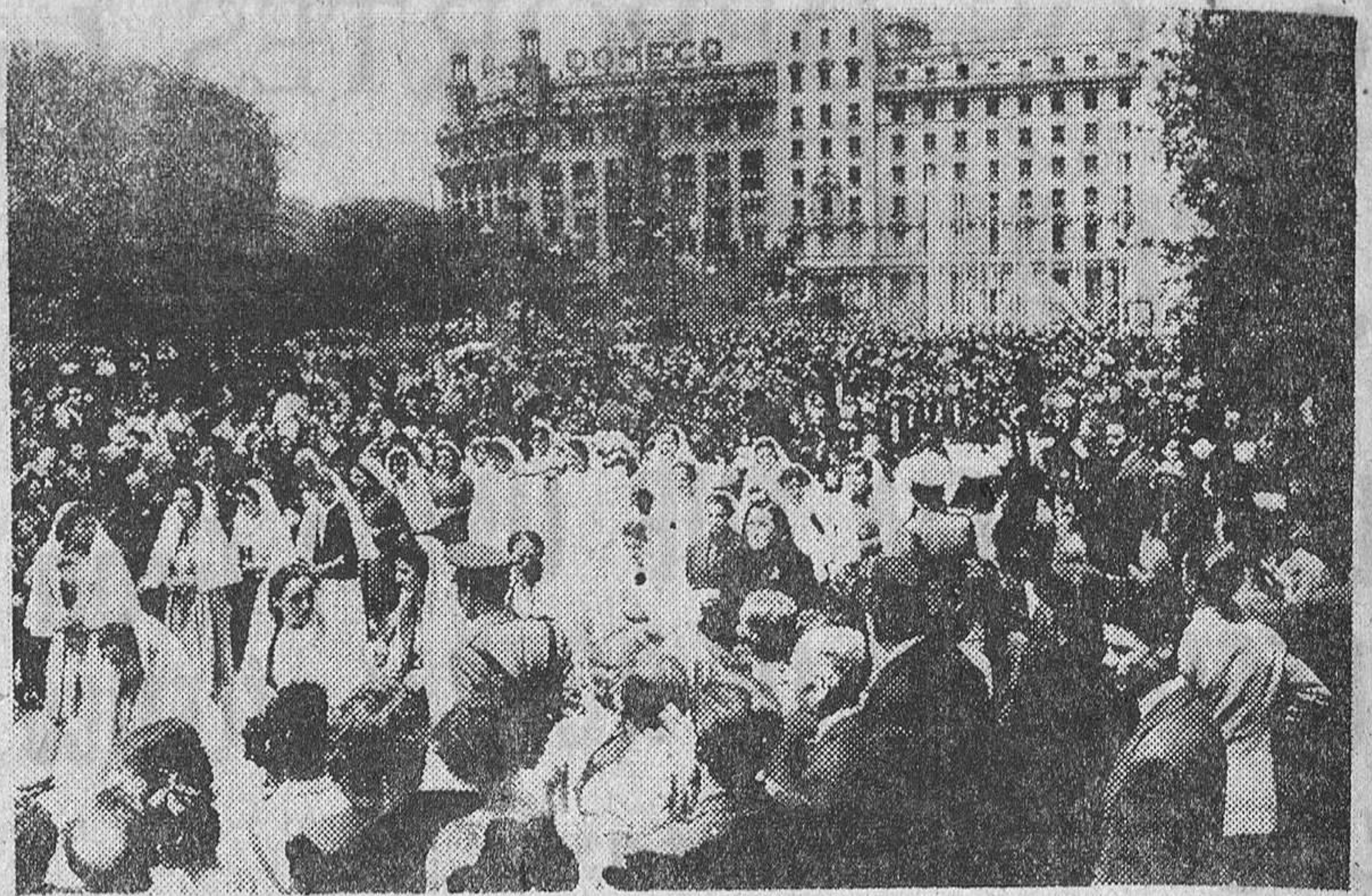
Los niños y niñas de las Escuelas de Barcelona se concentraron en la Plaza de Cataluña para oír el pregón infantil. Ya ha comenzado la fase previa del Congreso Eucarístico Internacional. En la foto un momento del acto.