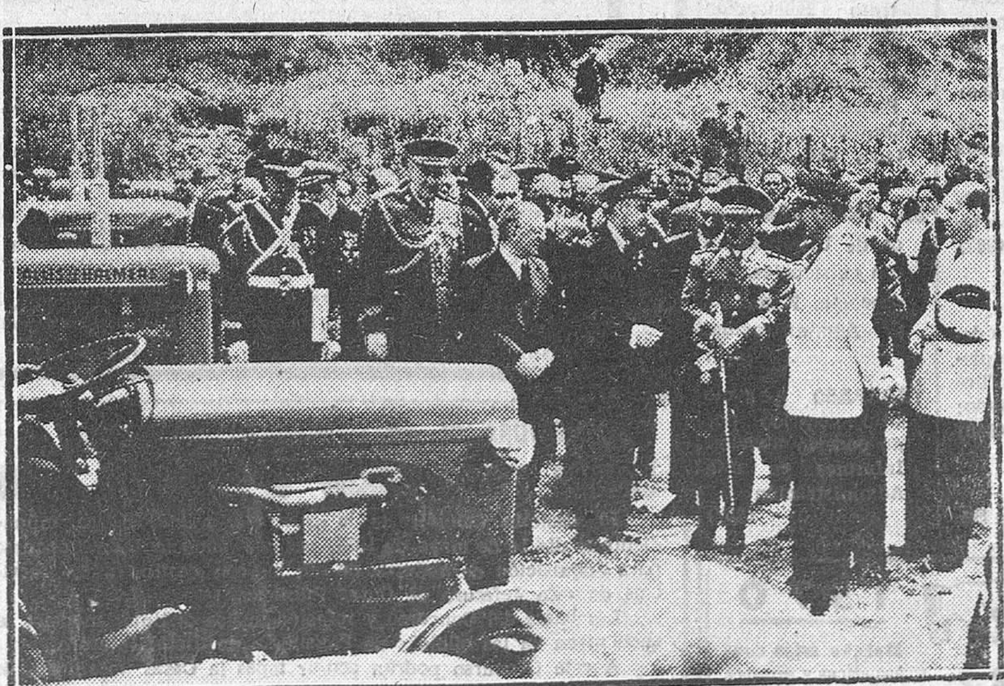
MADRID.—Su Excelencia el Jefe del Estado, Generalísimo Franco, acompañado de diversos y altas personalidades, durante la visita efectuada en la Escuela de Ingenieros Agrónomos a la Exposición de tractores y material agrícola.

WASHINGTON, 17.—El secretario de Defensa, Robert Lovett, ha dicho en una conferencia de prensa que si los comunistas en Corea empiezan a emplear gases venenosos y armas bacteriológicas, lamentarán haber nacido.—Efe.