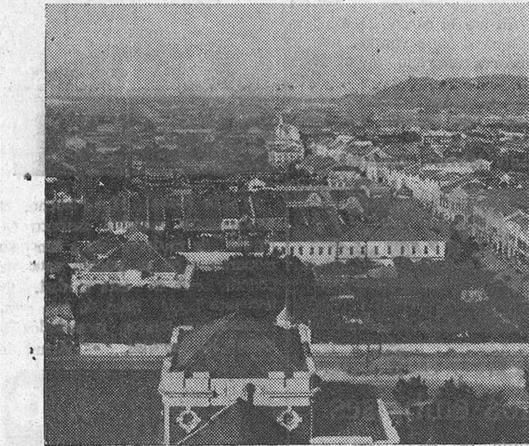
Una vista de la capital de Formosa, isla avanzada contra el comunismo.

En Formosa se dice que la isla no puede ser invadida por los comunistas por dos razones: un desembarco u operación marítima en gran escala es muy costoso y los comunistas no poseen aún los medios para transportar sus fuerzas. La segunda razón está rubricada por la séptima flota de los Estados Unidos, que defiende el litoral de la isla.