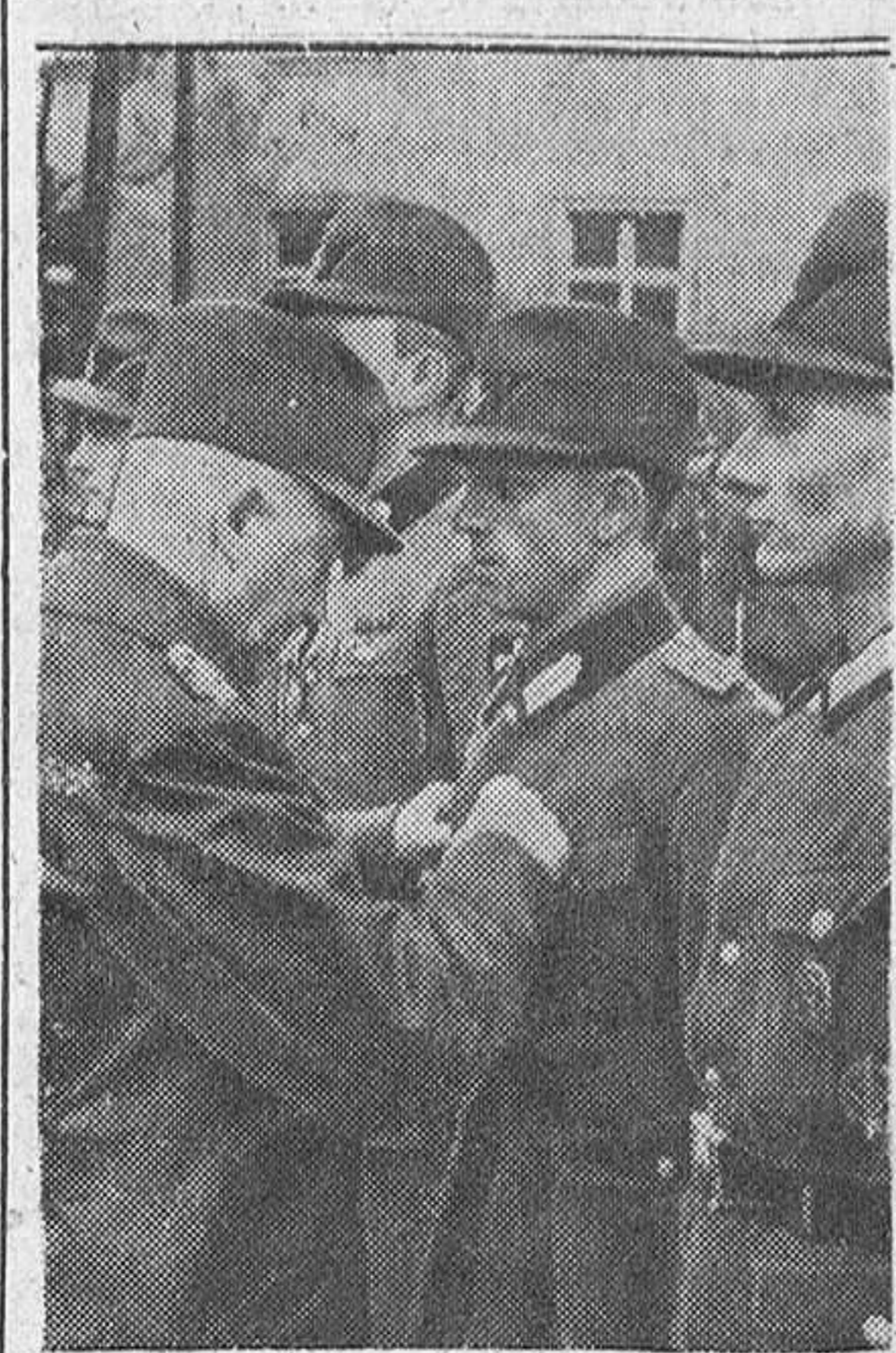
El jefe de Trabajo del Reich, Hierl, condecora a un grupo que se distinguió en los trabajos realizados después de un bombardeo angloamericano sobre Berlín.