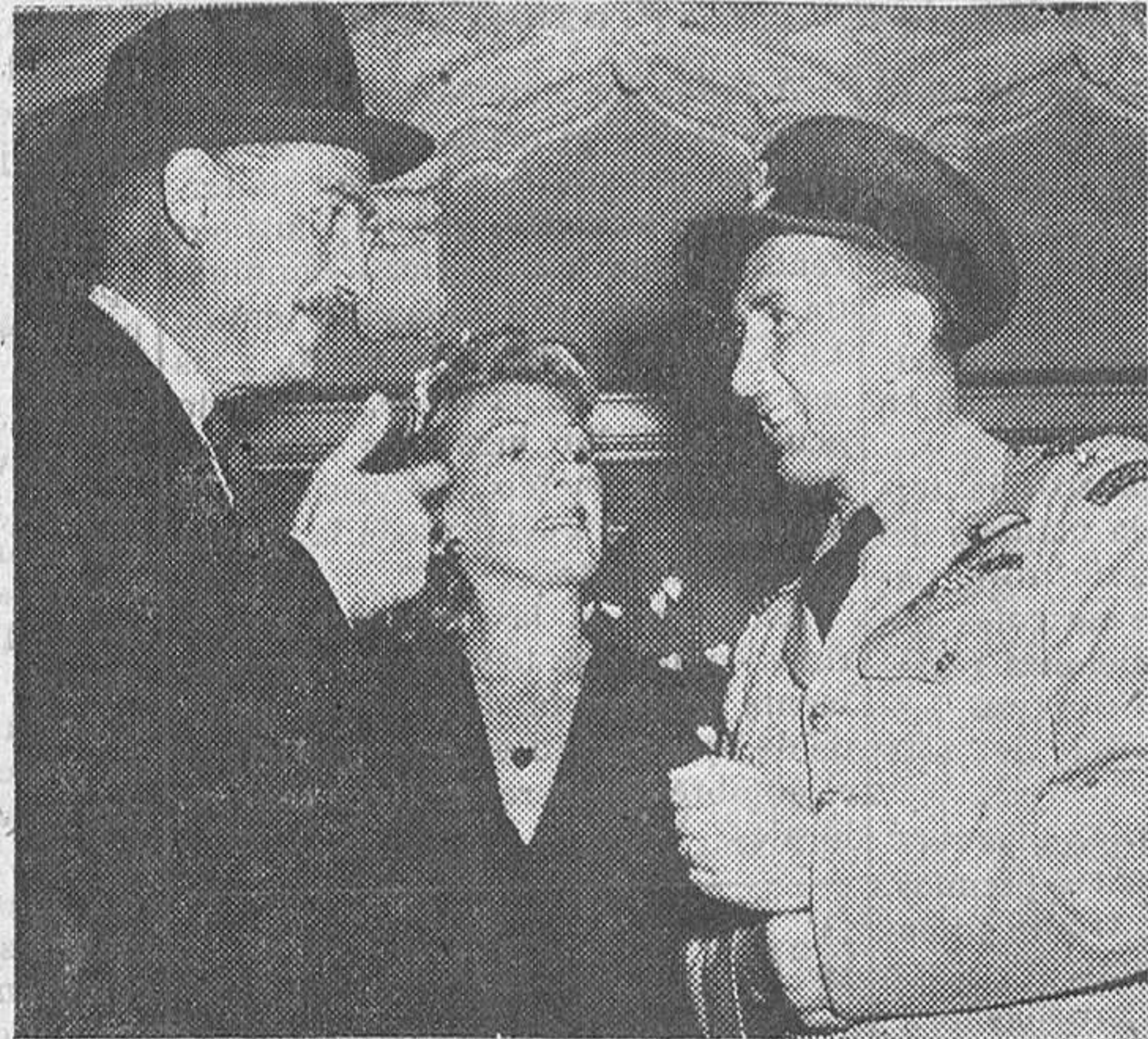
Paul Lukas, protagonista de «Watch on the Rhine», y su esposa asisten al estreno de la película y se detienen un momento para hablar con el capitán Karel Kuttlewascher, de las fuerzas aéreas checoslovacas.

Lukas apareció por primera vez en la pantalla en la película «Los amores de una actriz»,