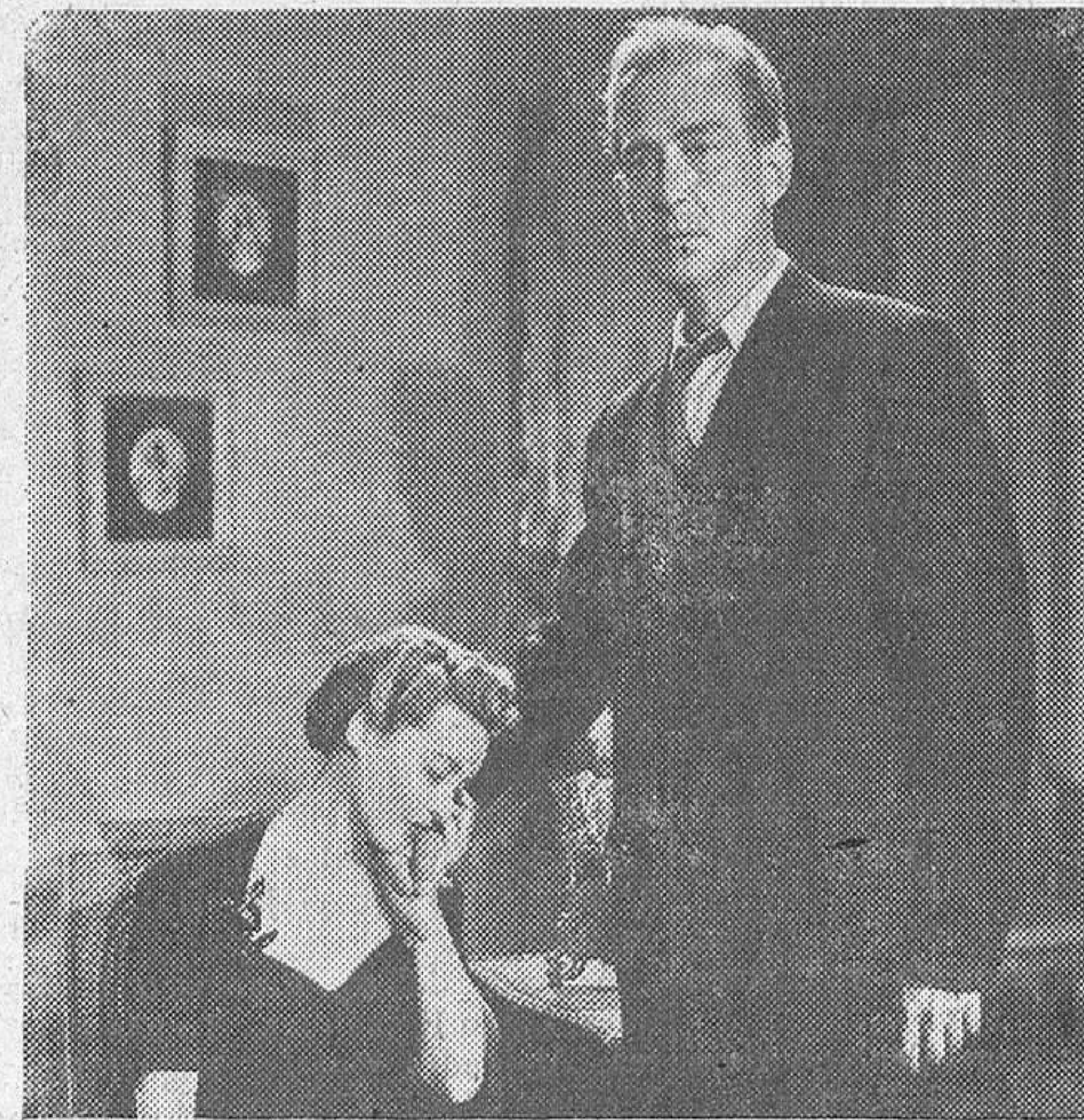
Paul Lukas, actor de origen húngaro, elegido recientemente como el actor cinematográfico más destacado del año, y Bette Davis en una escena de la película «Watch on the Rhine»