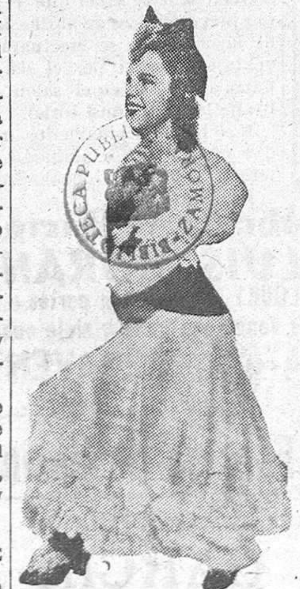
esta una producción que vale la pena. Se refiere a cosas reales.

Hace un año Judy se casó con el compositor Dave Rose y no estamos seguros de que a estas horas no estén divorciados.