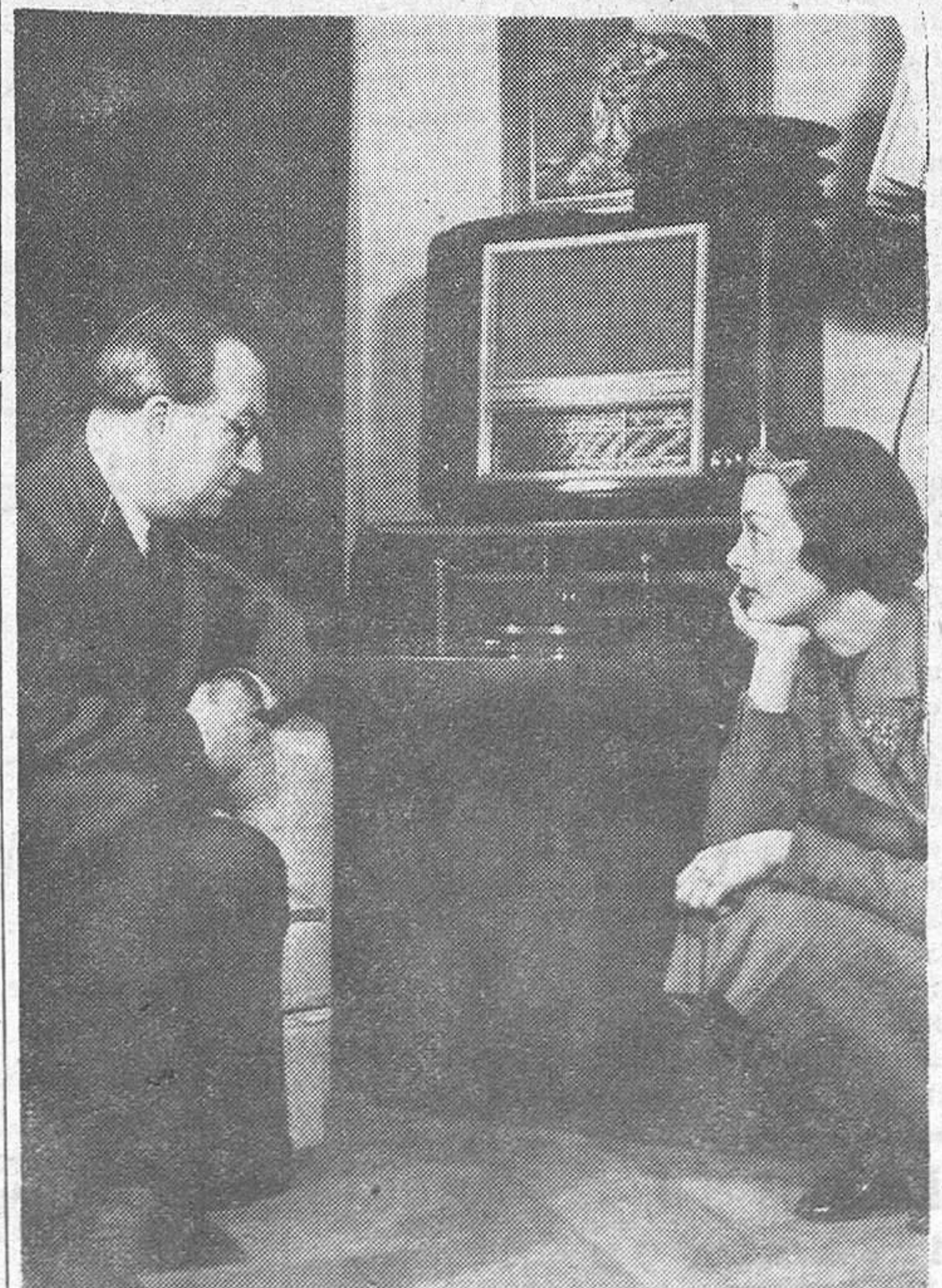
Ilse Werner, famosa artista del cine alemán y el compositor Adolf Steimer escuchan el disco «Así no puede seguir más...», escrito especialmente por Steimer para Ilse. La grabación está hecha en cera y puede ser corregida antes de hacerla definitiva.