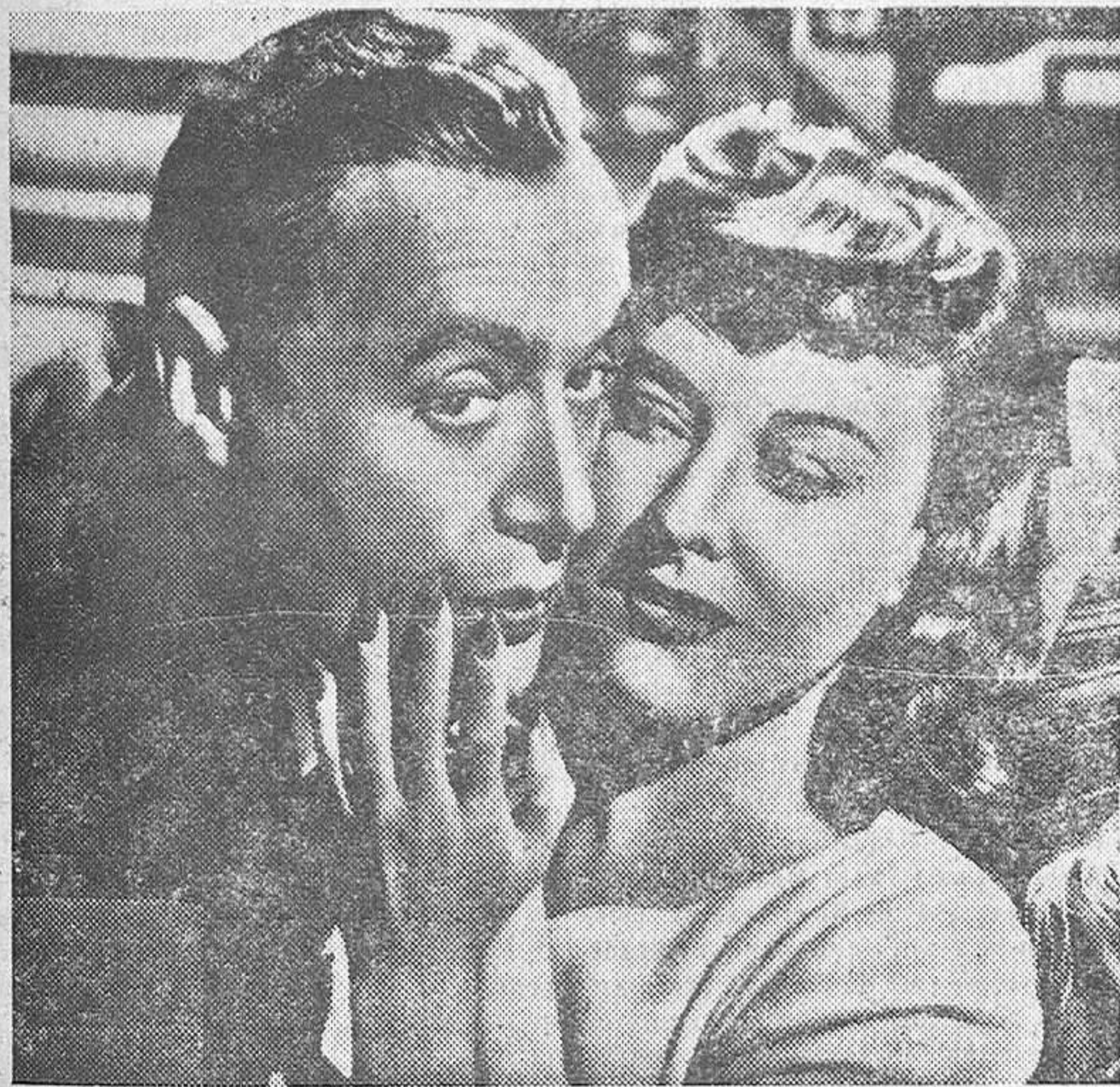
Paulette Goddard con Charles Boyer en una escena del film «Si no amaneciera»

tro de unos días—lo que quería era colocarme en aquel ambiente para tratar de dar cuenta a mis lectores de lo que es un gran estreno en el Teatro Chino.