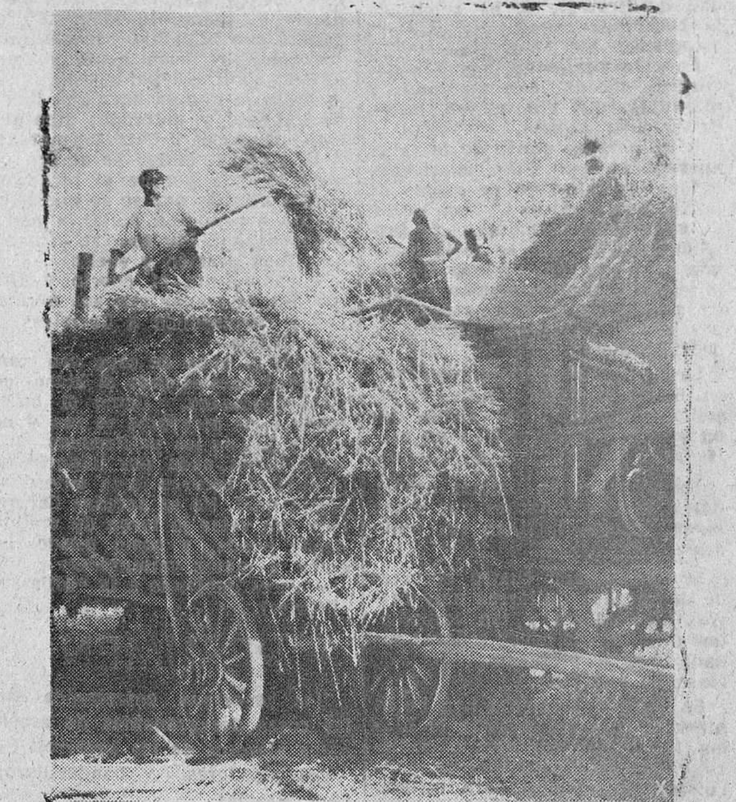
Echando gavillas a una trilladora

MORTANDAD DE POLLOS EN LA PROVINCIA DE BURGOS De la comarca de Villaquirán de los Infantes (Burgos) nos informan que en aquellos pueblos hay una verdadera mortandad entre los pollos atacados por la peste aviar. Las bajas mucho menos numerosas entre las aves adultas. Parece ser que por allí anda algo descuidada la vacunación preventiva, de lo que son únicos responsables los avicultores por cuanto como en todas partes, hay vacuna en abundancia. Siguera, pues, algunos erradores de ponedoras, tirando piedras a su propio tejado. EL MERCADO DE LOS HUEVOS Noticias de última hora indican que en la provincia de Burgos se pagan los huevos entre 19 y 20 pesetas docena; en la de Alava entre 18 y 20 y en la Serena (Badajoz) a 17.