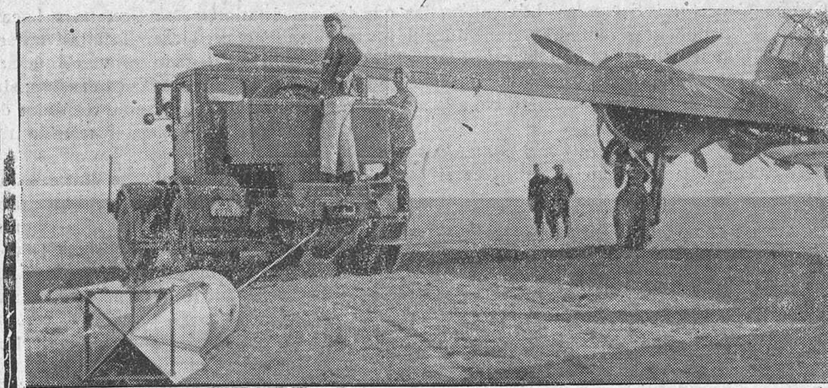
Incesantemente llegan a los aeródromos de campaña los artefactos mortíferos para ser empleados, minutos más tarde, en los grandes ataques contra los centros importantes de Inglaterra.

SECRETARÍA LOCAL DE F. E. T. Y DE LAS J. O. N. S.