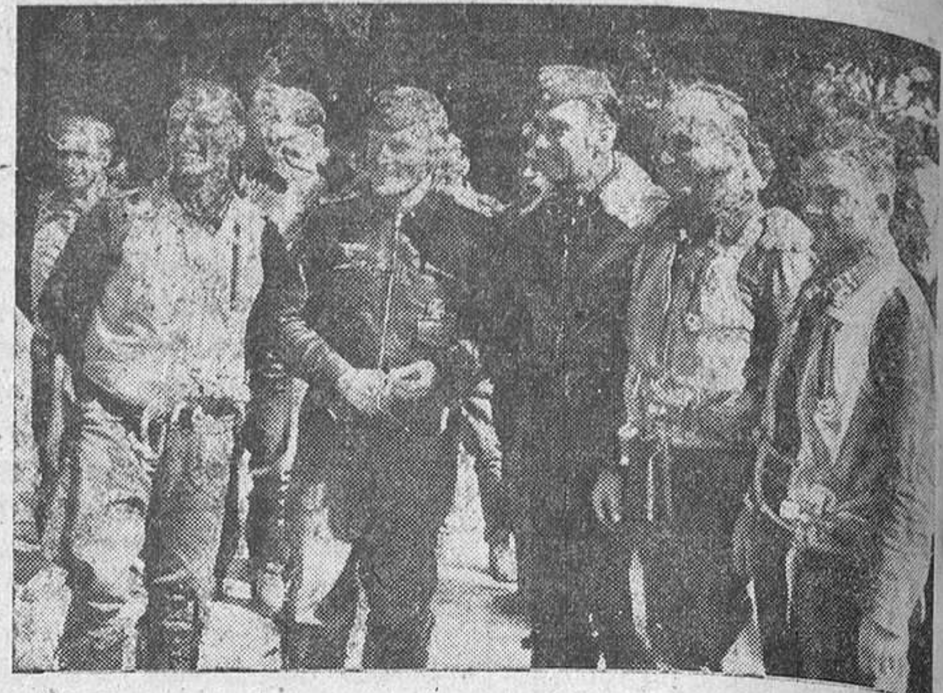
El comandante laureado Molders (con guerrera de cuero y cuello blanco) y los camaradas de su escuadrilla de cazas muestran su gran alegría por la última victoria lograda contra los cazas ingleses