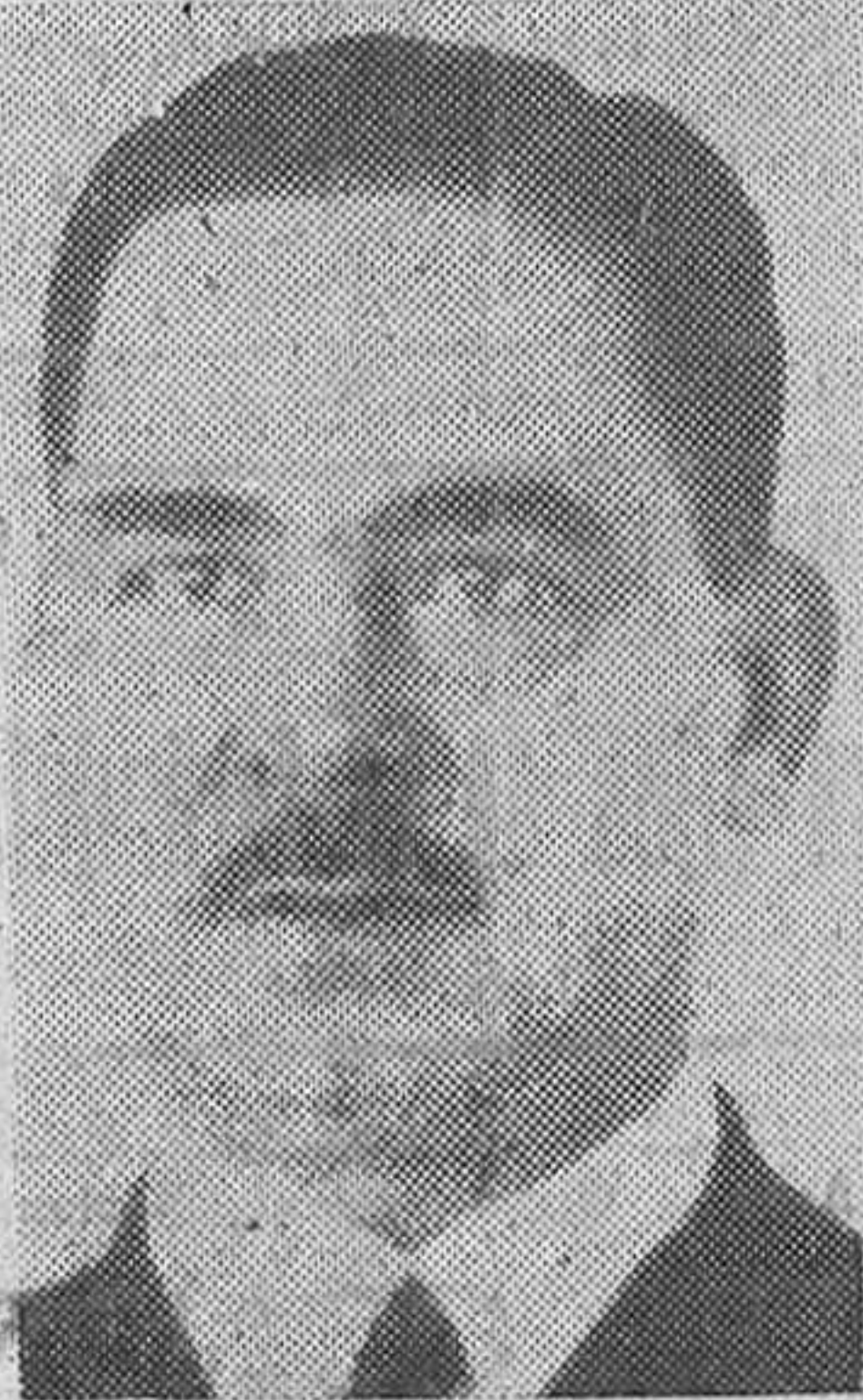
Ministro de Marina

Una vez unida España, no solo por la profesión de la misma fe, sino también en el orden político, nuestros Reyes Católicos, forjadores de nuestras pasadas grandezas, buscan más amplios horizontes a la fe predicada por vos en nuestros suelos, y bajo la dirección materna de Isabel y la fe de Colón y de los Pinzones se produce uno de los aciertos más grandes de la Historia después de la Re-