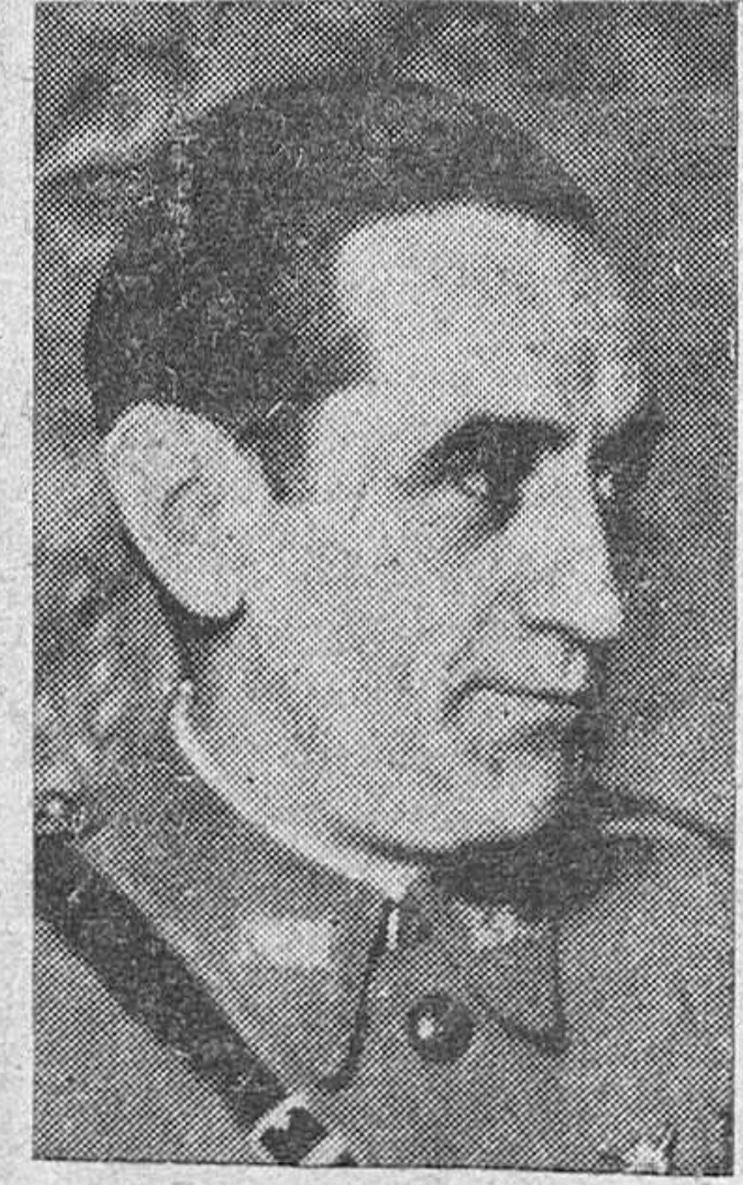
General AGUSTIN MUÑOZ GRANDE, Secretario de la Junta Política

las necesidades de consumo, sin aportación de existencias de ninguna clase, en la zona últimamente liberada, con una producción nula y una total ausencia de reservas. Y esta desproporción entre la existencia y el consumo, produce, como consecuencia, el desate codicioso de la especulación. El abastecimiento normal de España, exigiría cuatrocientos mil vagones de trigo para su distribución en todas las provincias. Las existencias de que hoy disponemos no cubren ni con mucho las necesidades del consumo. La mala cosecha ha dado también una situación deficitaria, en el aceite. La disminución de la producción ganadera, originada principalmente por el aniquilamiento de la ganadería en la parte del país últimamente liberada se han hecho evidentes, con la consiguiente escasez de leche, e n términos tales, que con una producción actual aproximada de mil veintres millones de litros, no llegamos a cubrir ni la cuarta parte de las necesidades. En legumbres secas y en arroz, para cubrir las 600 600 toneladas del consumo anual, tenemos un déficit inicial de 120.000, y para una cifra de 300.000 toneladas, azúcar un déficit de 180.000, constituyen-