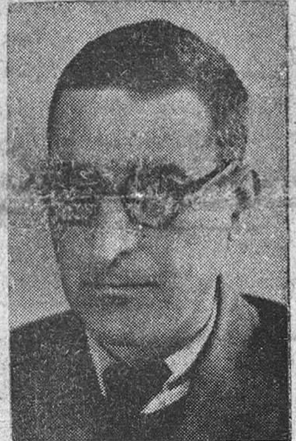
RAFAEL SÁNCHEZ MAZAS, Vicepresidente de la Junta Política

consecuencias, graves y extensas en las dificultades del abastecimiento nacional. En el aspecto económico, el fin de la guerra se señala por un aumento extraordinario de