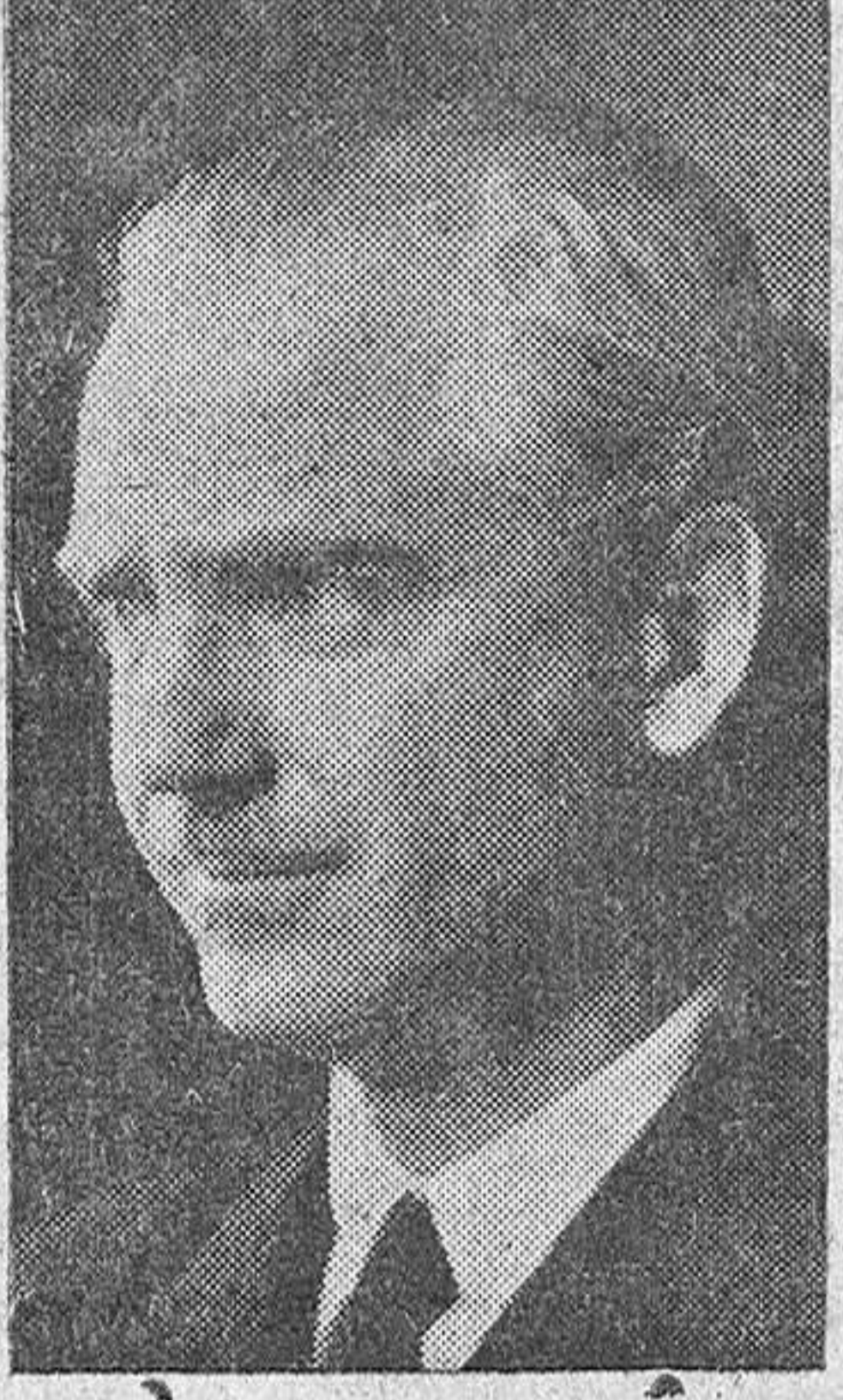
RAMÓN SERRANO SÚÑER, Presidente de la Junta Política

La primera Junta Política que José Antonio fundara, for-