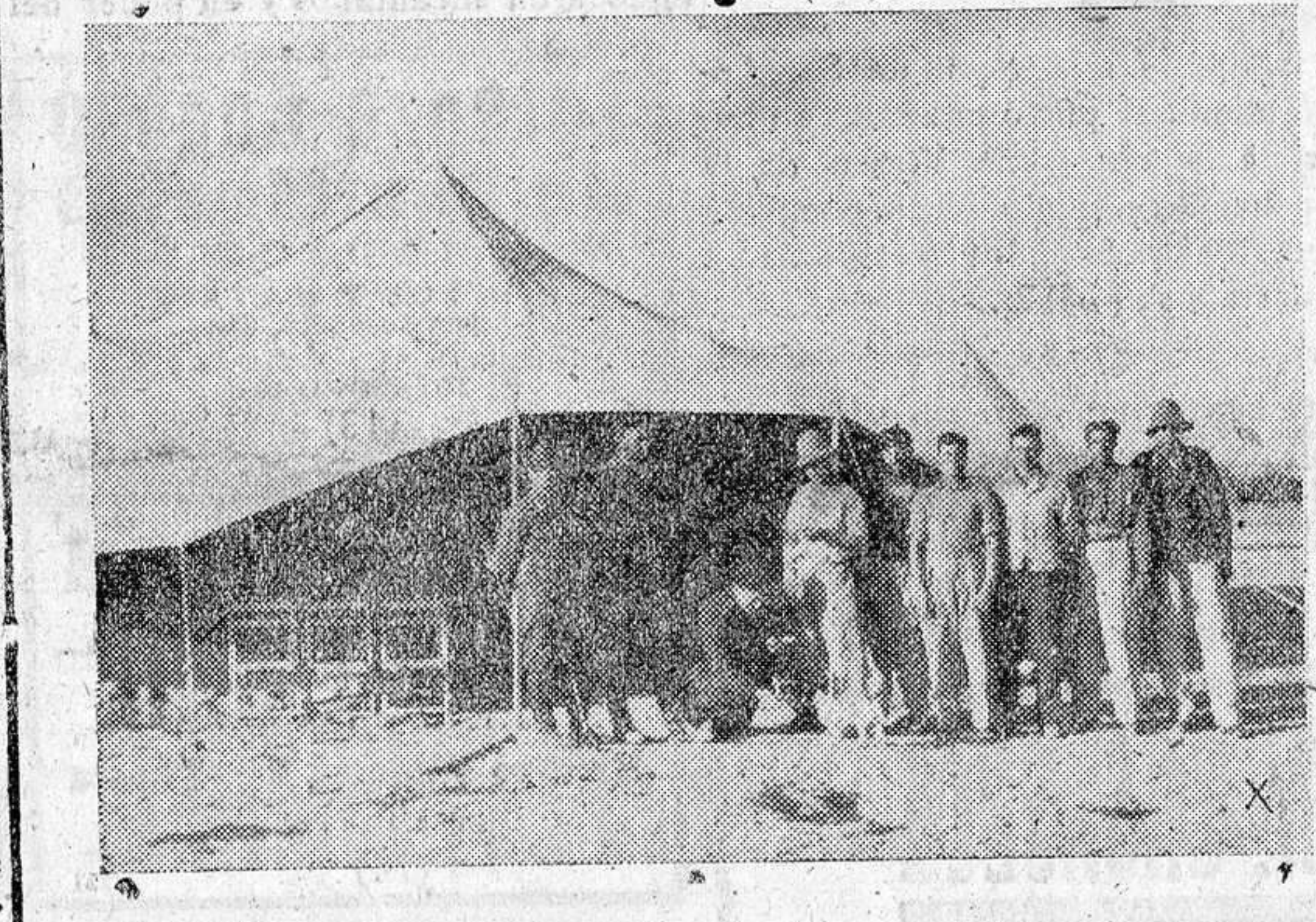
Descanso de aviadores alemanes en el desierto de Africa