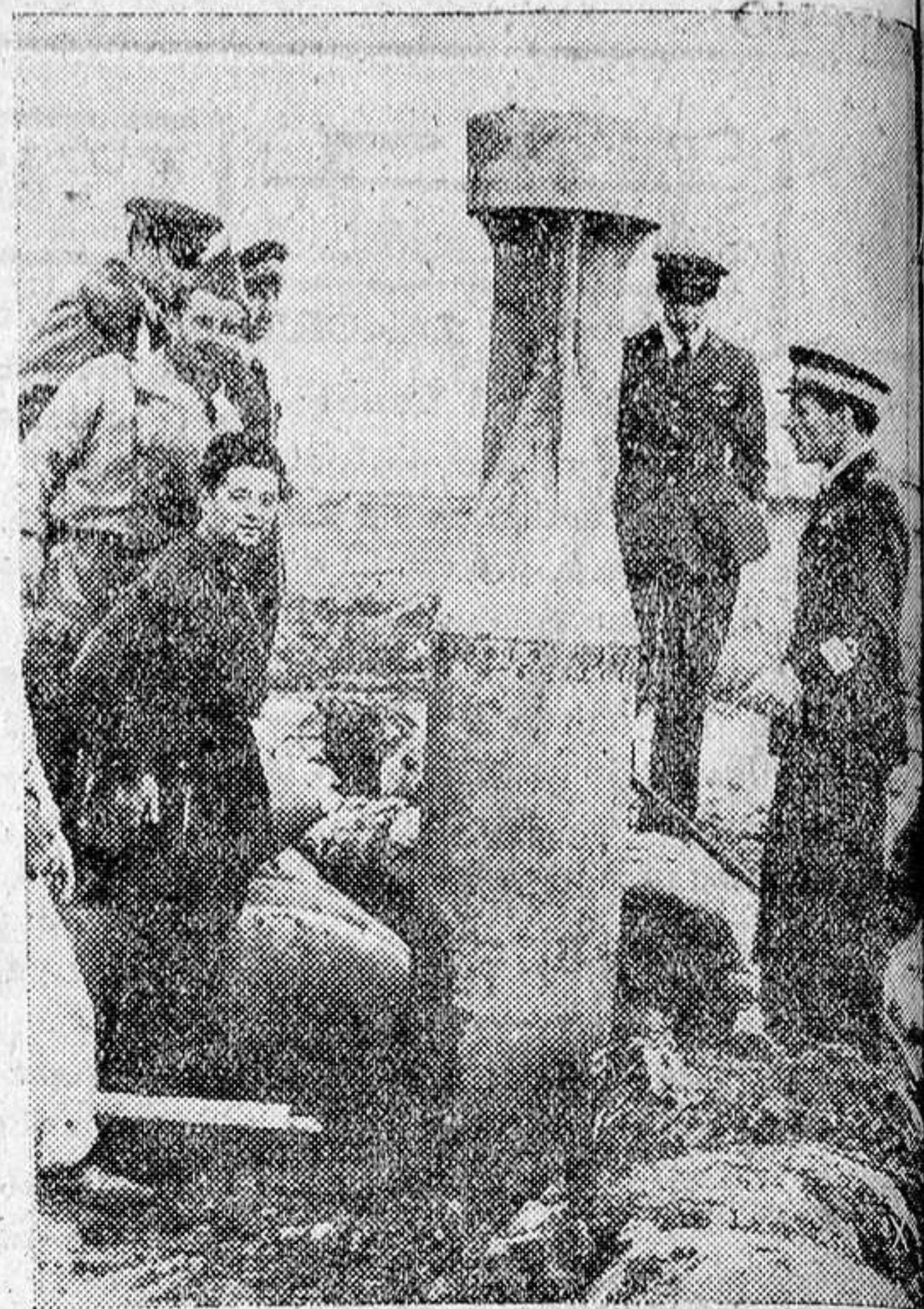
Bombas de grueso calibre que utiliza la aviación italiana para bombardear objetivos militares importantes

Berlín, 25.—La escuadrilla alemana que estos días efectuó varios ataques sobre Inglaterra, volando a unos 20 metros de altura, ha destruido algunos cobertizos, bombardeando con pleno éxito otra base de la aviación británica. El objetivo principal fué un aeródromo, ocupado por numerosos aparatos «Bristol» y «Blehein».—Efe.