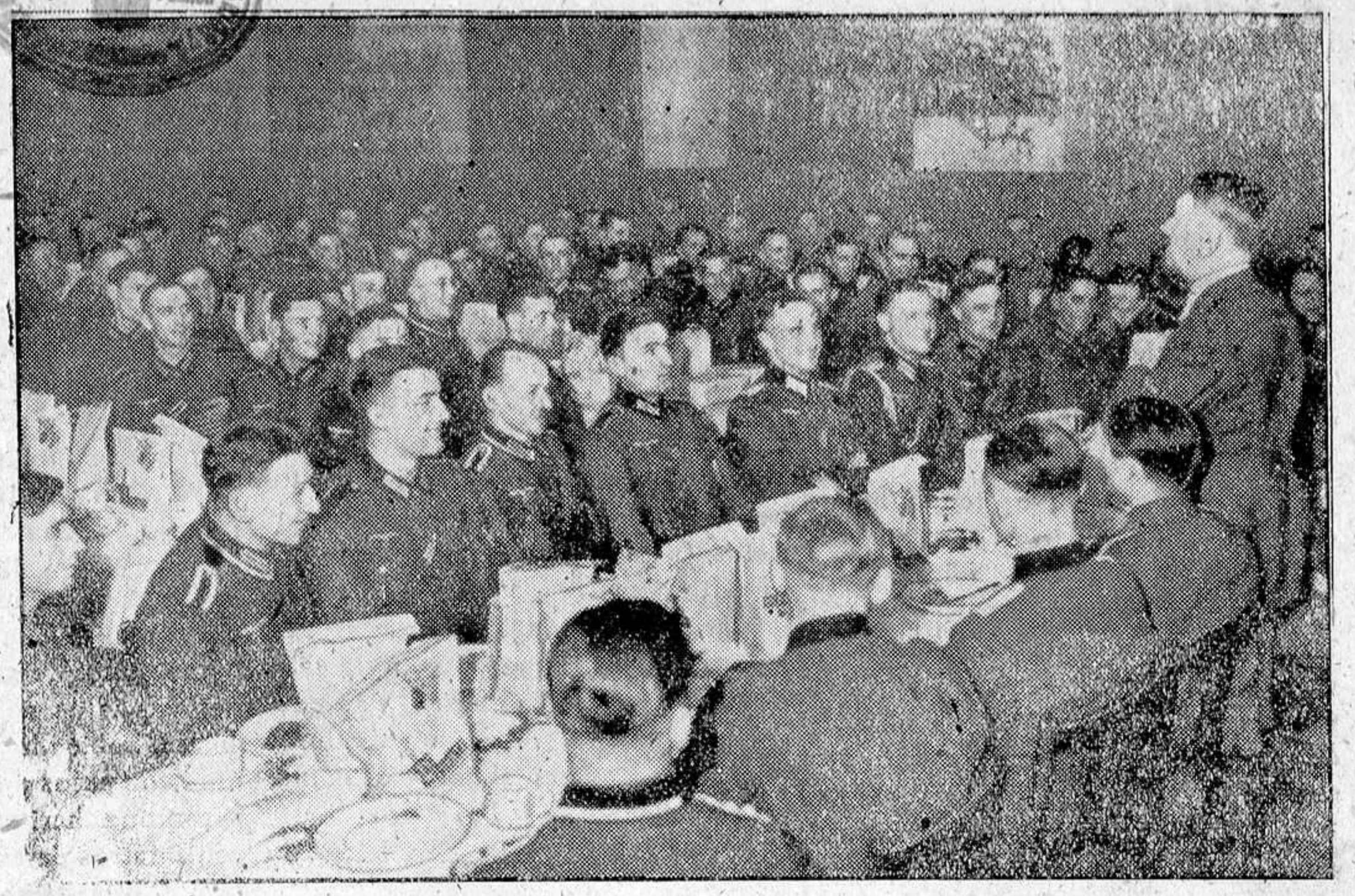
El Führer pasó el Año Nuevo entre los soldados de un Regimiento de Infantería que más se ha distinguido en las campañas del año pasado

Roma, 3.—En los medios competentes italianos se califican de grotescos y extremadamente ridículos, los rumores difundidos por una Agencia norteamericana, según los cuales Italia tiene intención de evacuar sus colonias.—Efe.