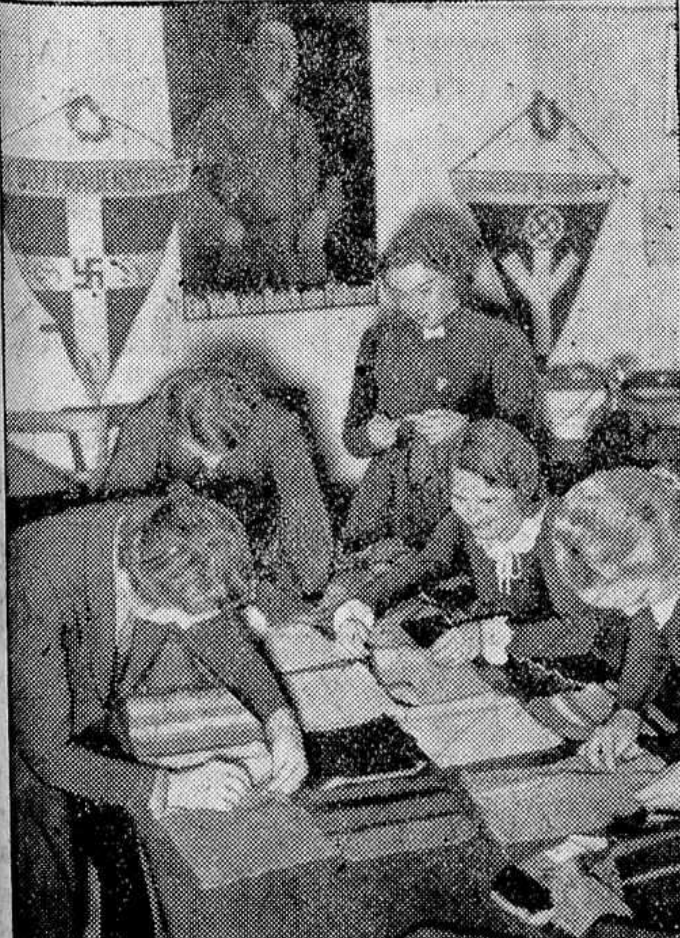
Las mujeres nacionalsocialistas dedican su tiempo libre a la confección de prendas de abrigo para los soldados

Barcelona, 3.—A 1.769.434,14 pesetas acciende ya la suscripción abierta en el Gobierno Civil, a favor de los damnificados por los temporales de Manlleu y Torelló.—Cifra.