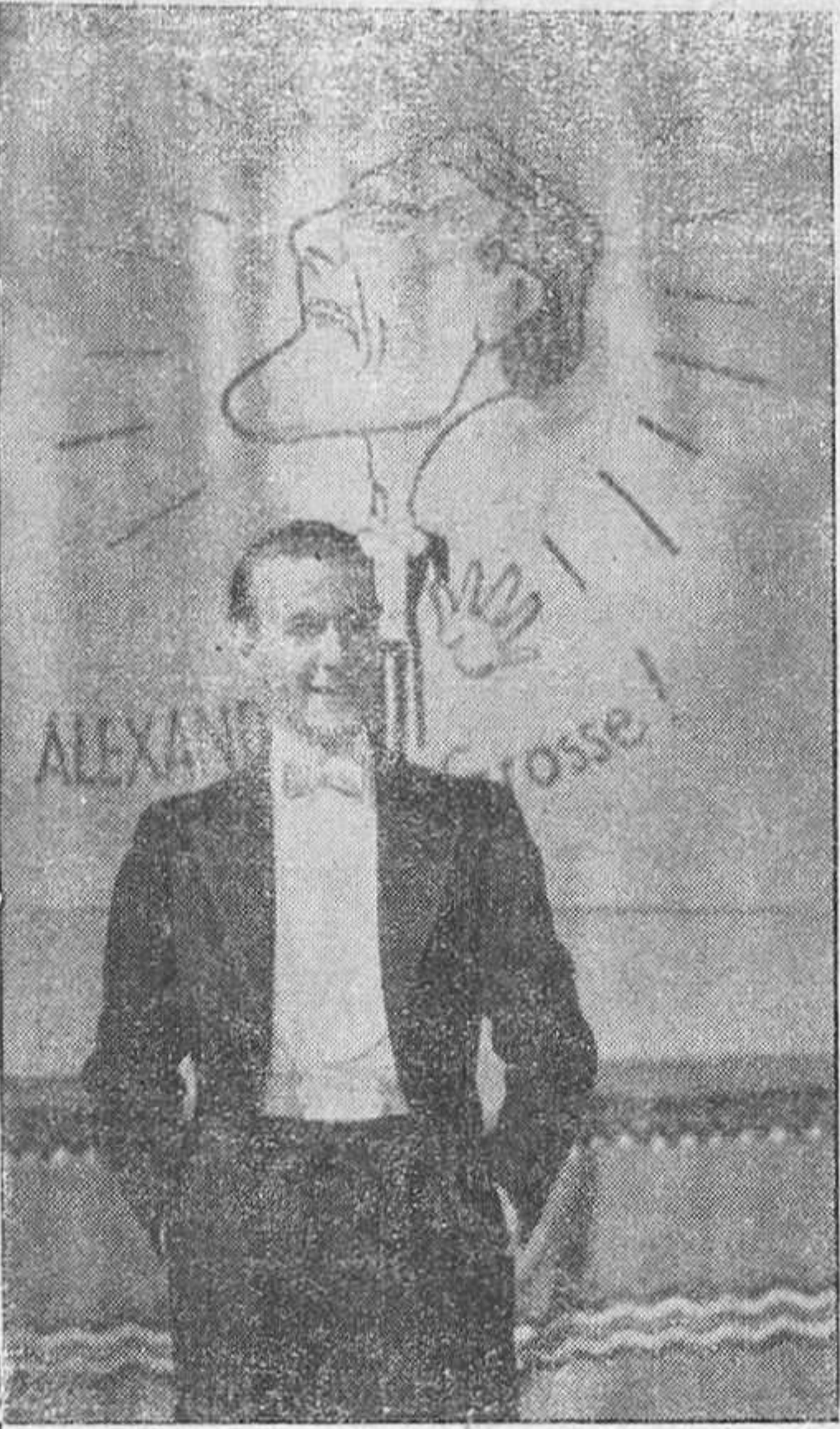
ALBERT MATTERSTOCK , simpático astro de la cinematografía alemana, que tras su triunfo en la película «El doble del Rey» ha iniciado una época de trabajo intenso en numerosas nuevas cintas, en las que obtiene el más rotundo éxito