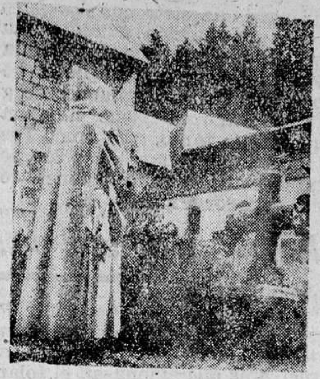
Uno de los pillos del Monasterio.

Francia, la nueva Francia del Viejo Mariscal, faustamente derrotada por Alemania—hay derrotas que constituyen las mayores victorias—se incorpora a la Europa grande que se está formando sobre los triunfos ininterumpidos y el empuje avasallador del pueblo germano.