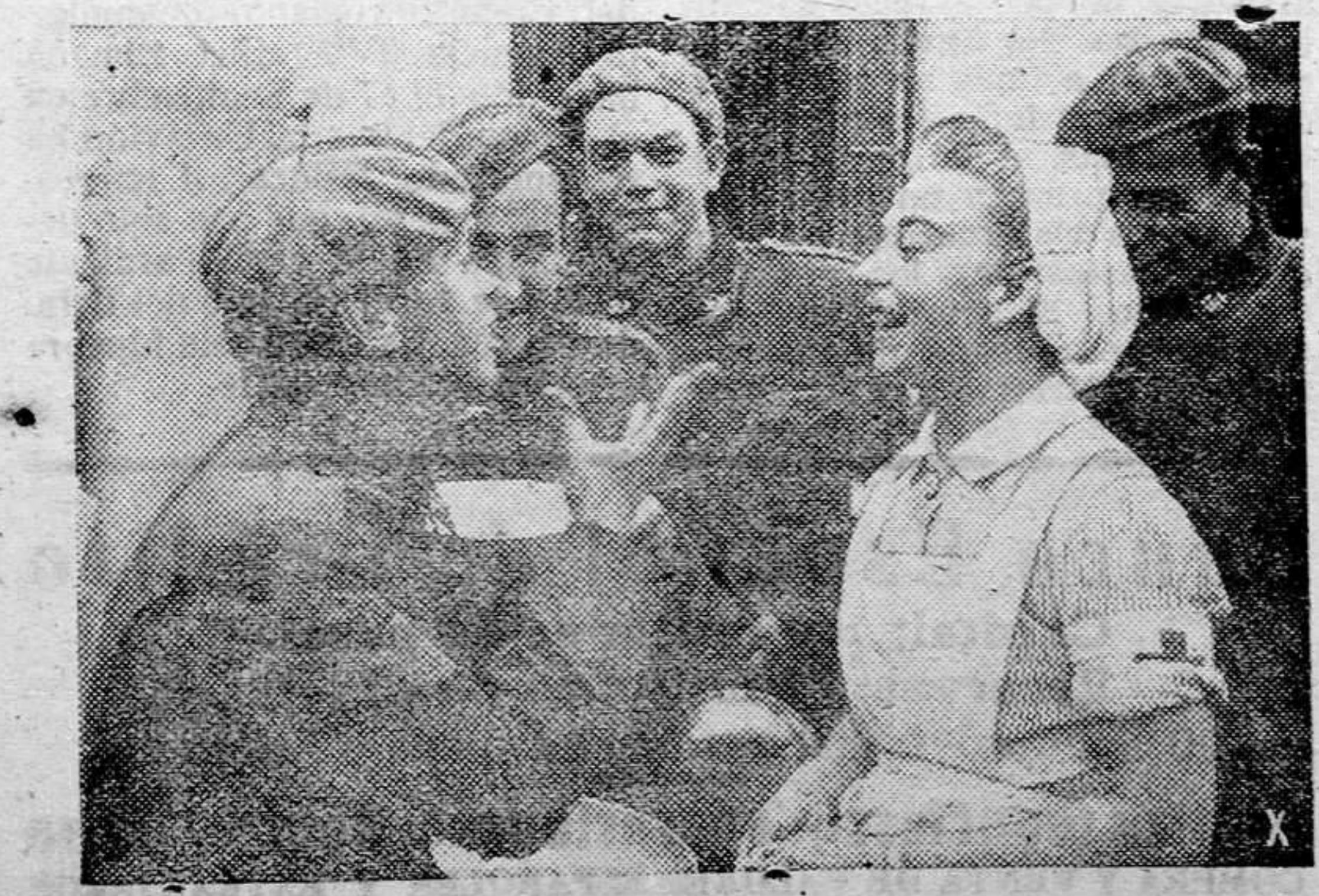
Esta estampa, que nos recuerda los primeros pasos de nuestros voluntarios por Alemania, testimonia la excelente camaradería reinante. Un voluntario, parco todavía de palabras alemanas expresa con el buen arte de la mimica sus simpatías a una camarada de la Cruz Roja.