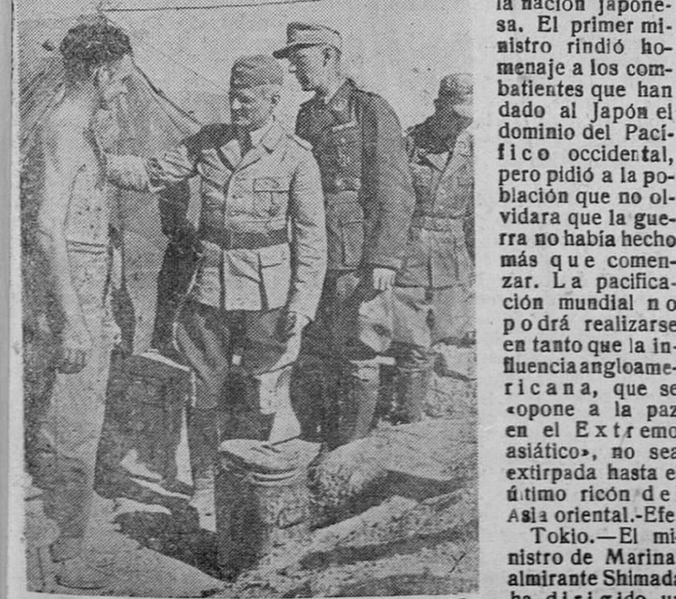
El inspector del servicio sanitario del arma aérea alemana en Africa, visitando las instalaciones sanitarias de una batería antiaérea en el frente libico.

contra un optimismo excesivo. Los japoneses, dijo, deben prepararse para una dura lucha, tanto en el frente interior como en las líneas de batalla.—Efe.