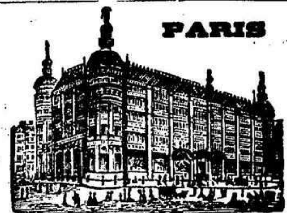
GRANDES ALMACENES DEL