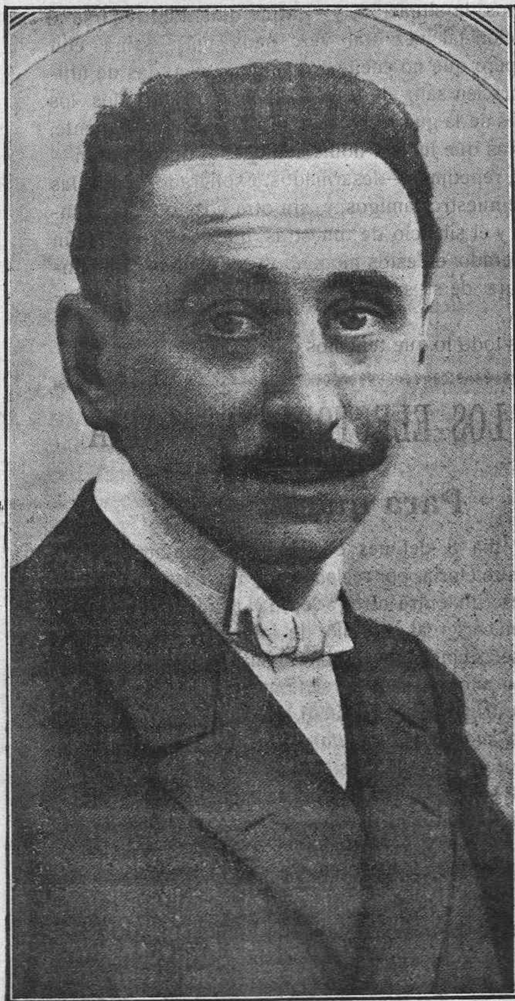
EL INSIGNE ORADOR D. MELQUIADES ALVAREZ