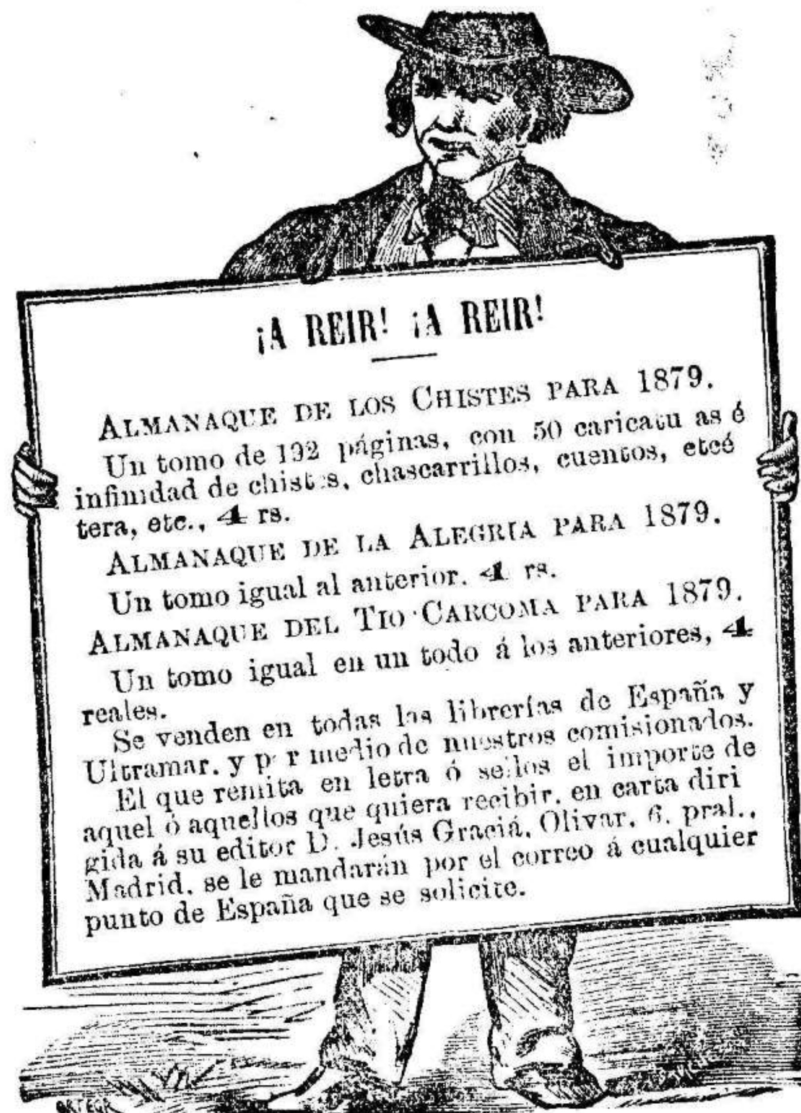
En Murcia en la imprenta de LA PAZ, Zoco, 5.