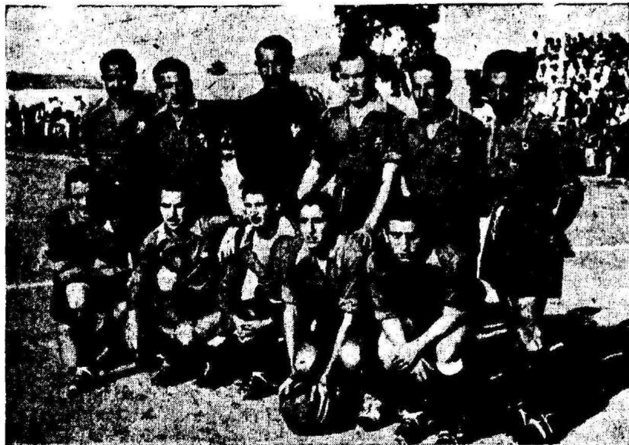
Conjunto del Cieza , integrado por entusiastas jugadores, considerados como futuras figuras de la cantera regional