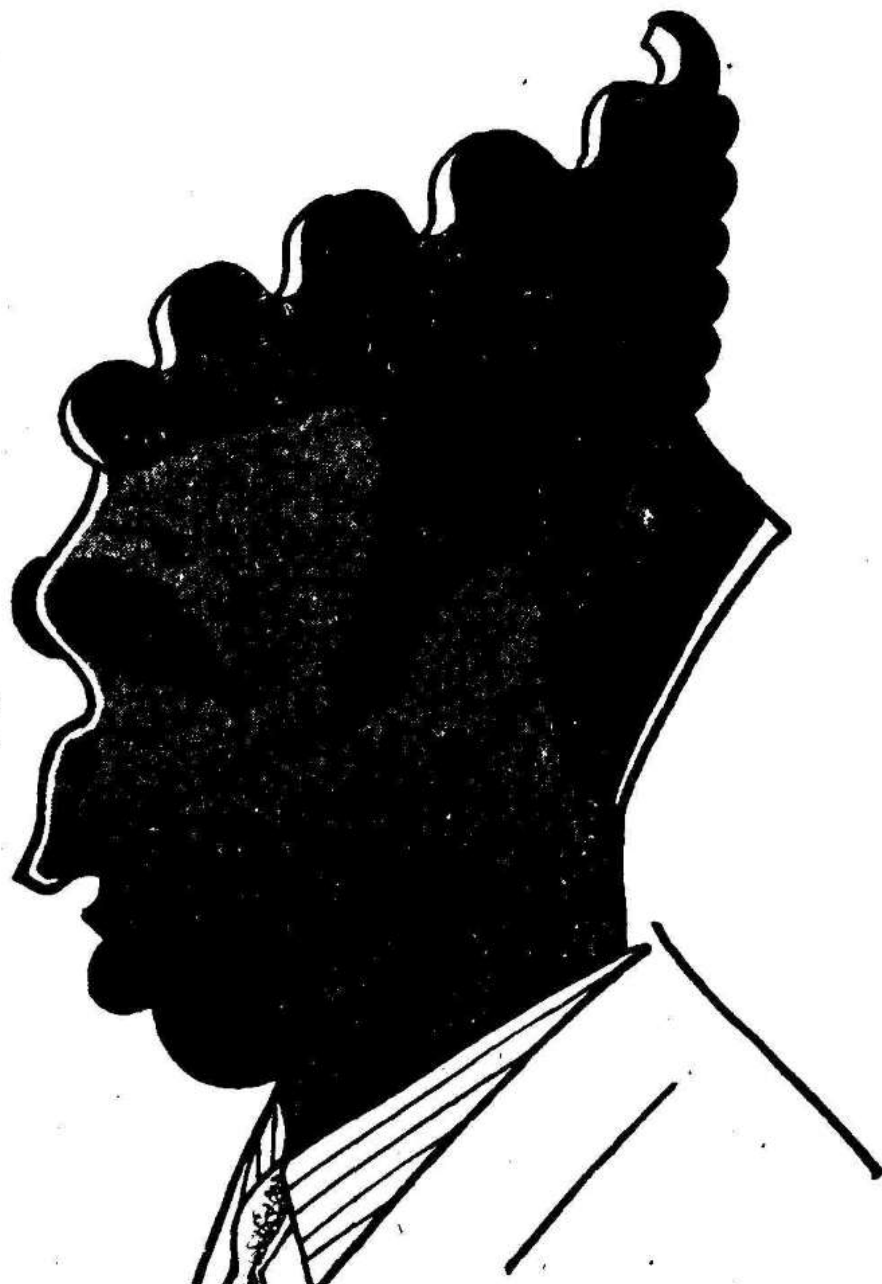
Bonet , de cuya preparación del conjunto murciano lo espera todo nuestra afición