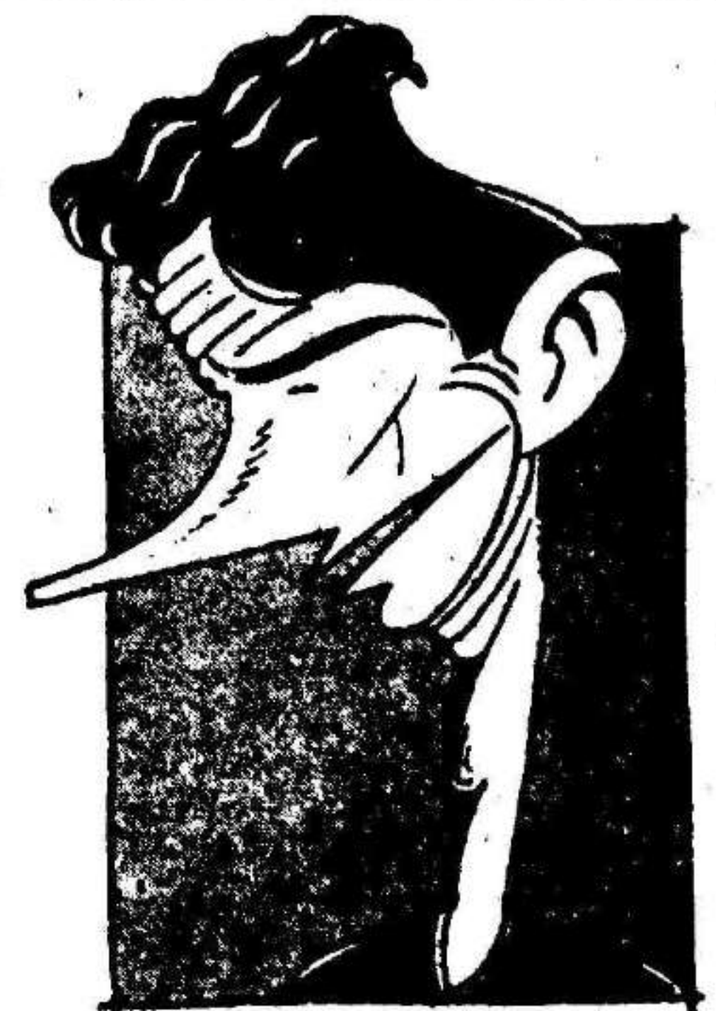
TITO I, que por su voluntad y tesón es digno de figurar en la División de Honor