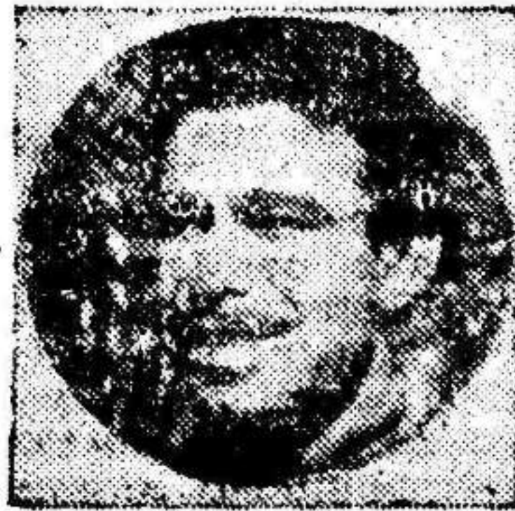
MESA el irregular mediocentro murciano

A las 6 y media en punto Vilalta, que arbitra ayudado por Rodriguez y Sabater, alinea así a los equipos: