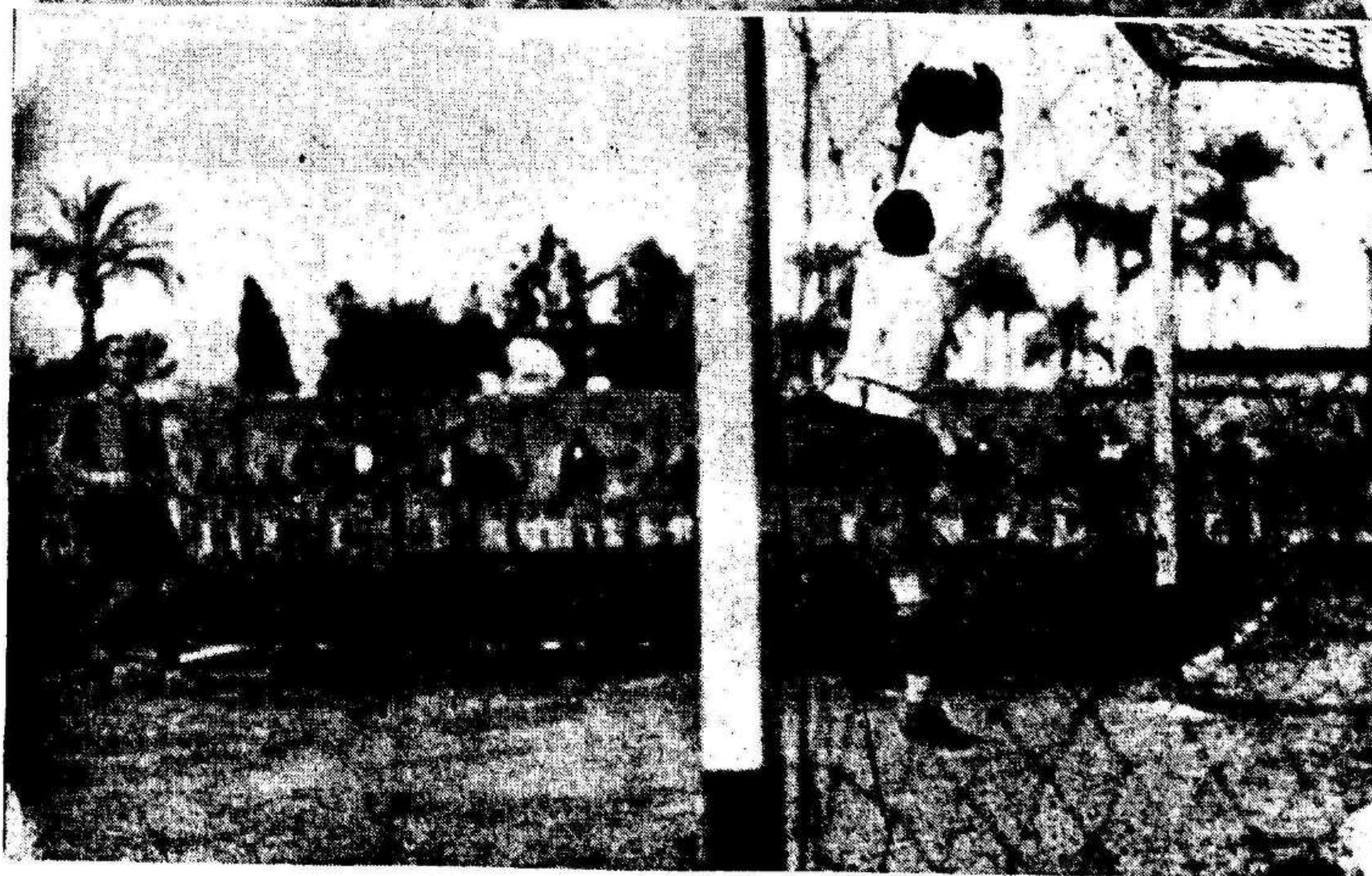
Los porteros del Alicante e Imperial, intervienen al detener sendos shoosts de las delanteras contrarias. El partido, del campeonato de Promoción, finalizó con la victoria de los alicantinos.