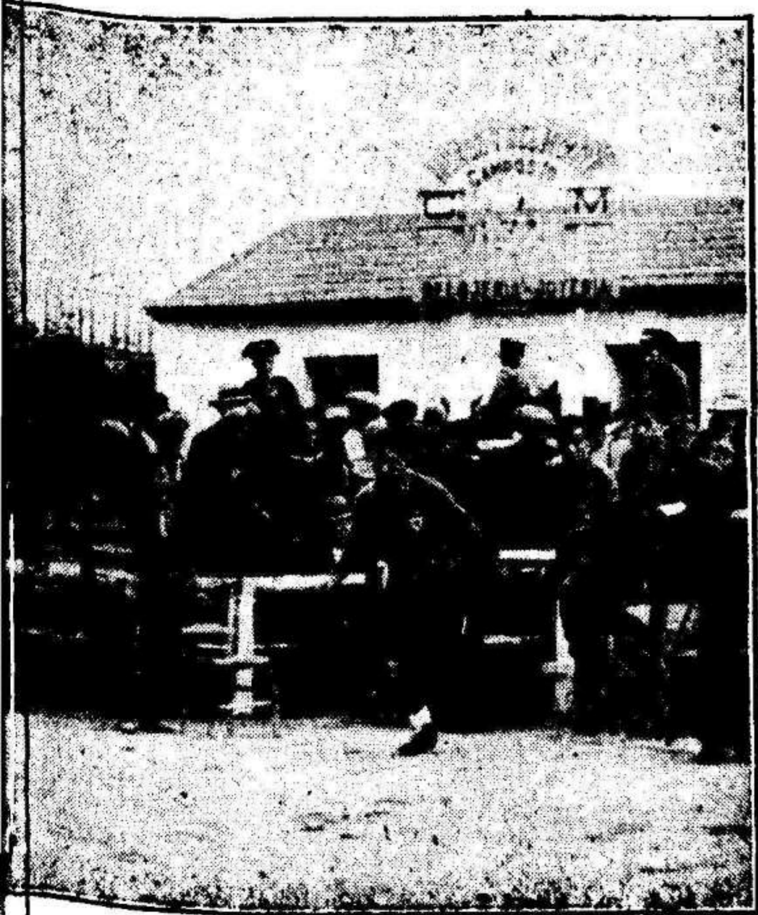
Entrada en el terreno del Almajar