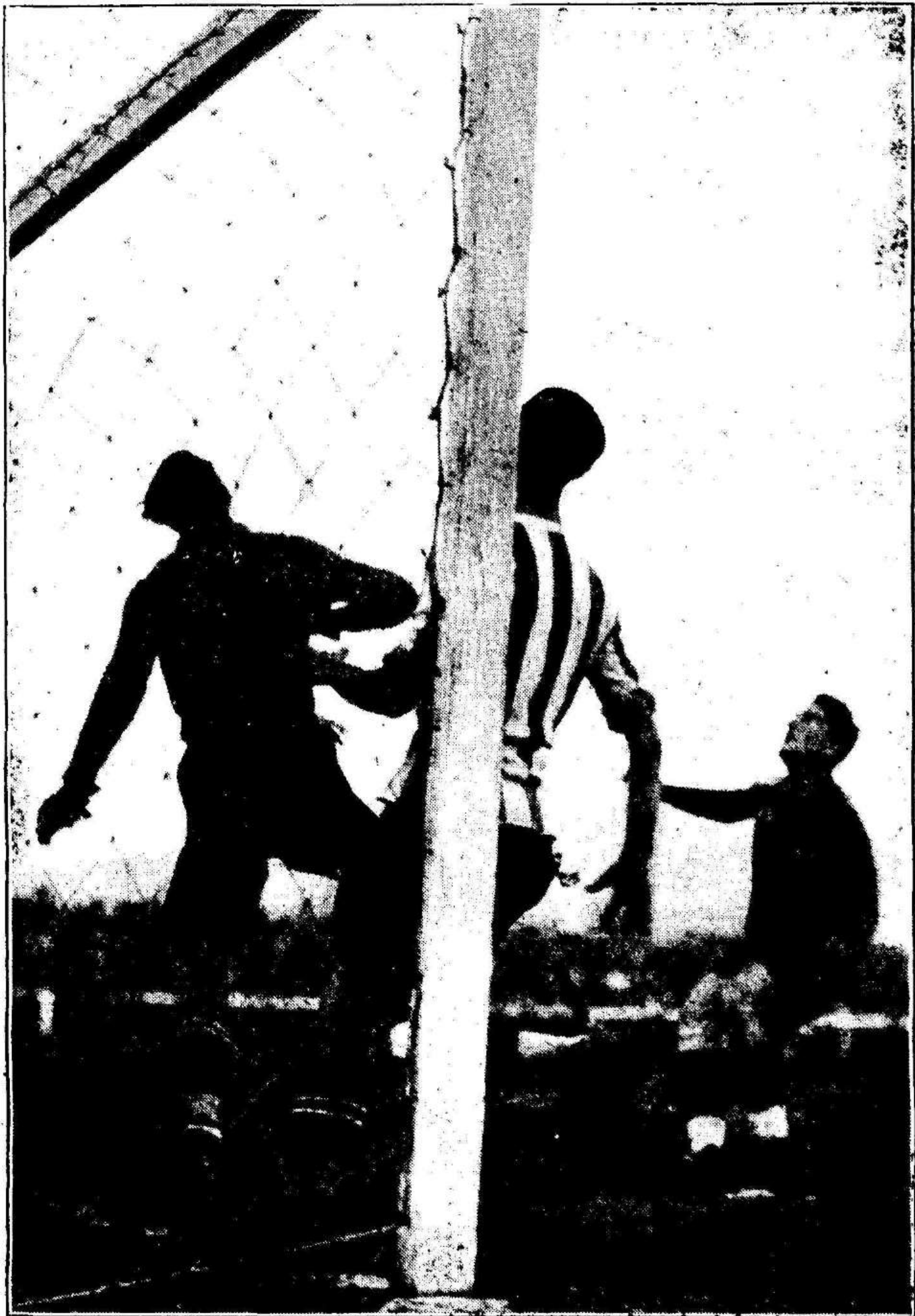
Grasch, el guardameta del Cartagena, despejando de «zamorana» una situación de peligro para su puerta.