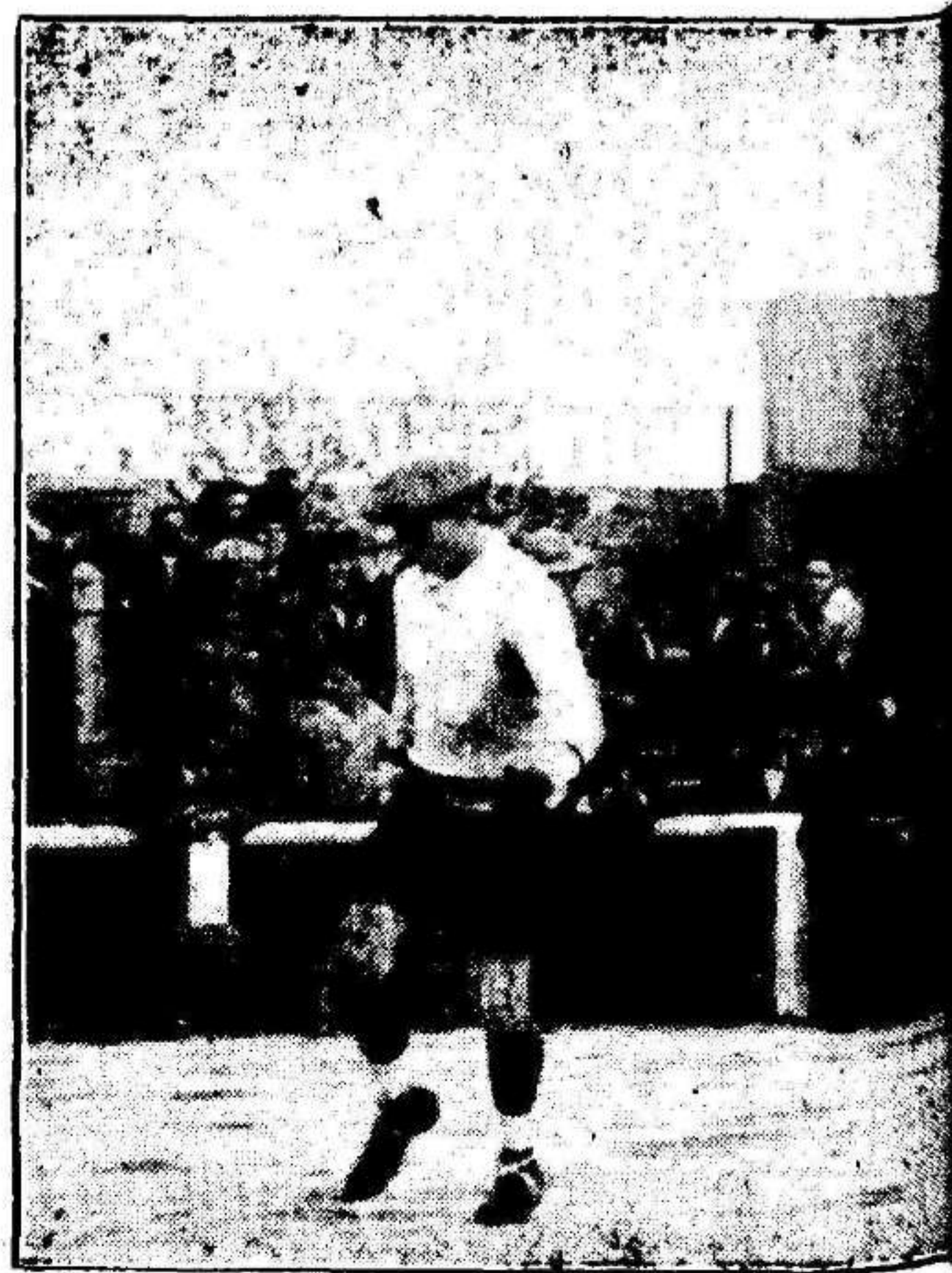
Los campeones regionales haciendo su