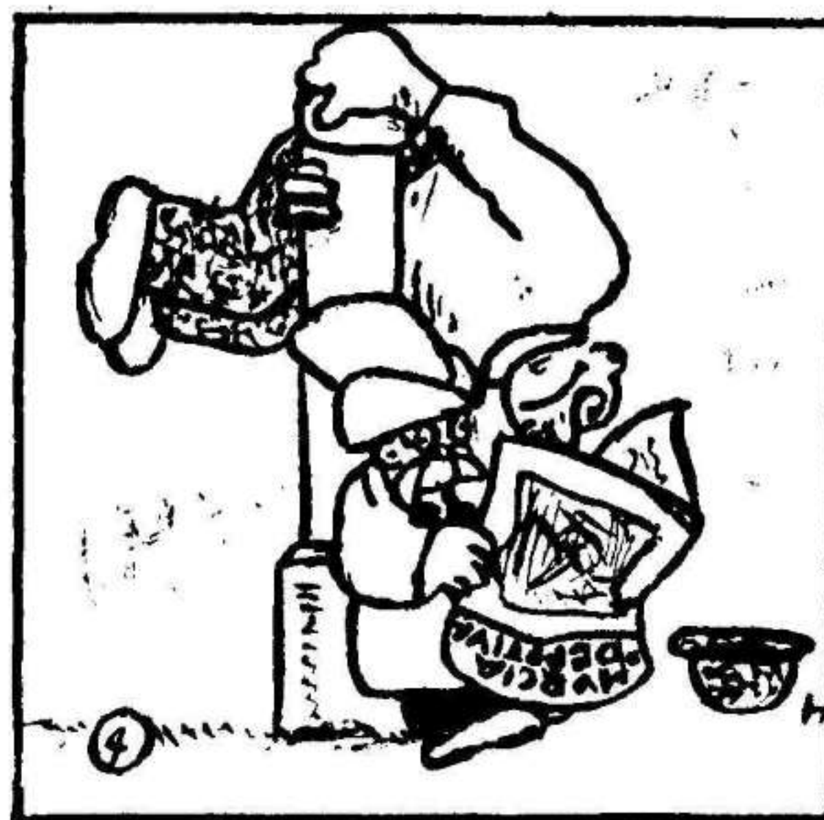
La lectura de la reseña del partido de fútbol.