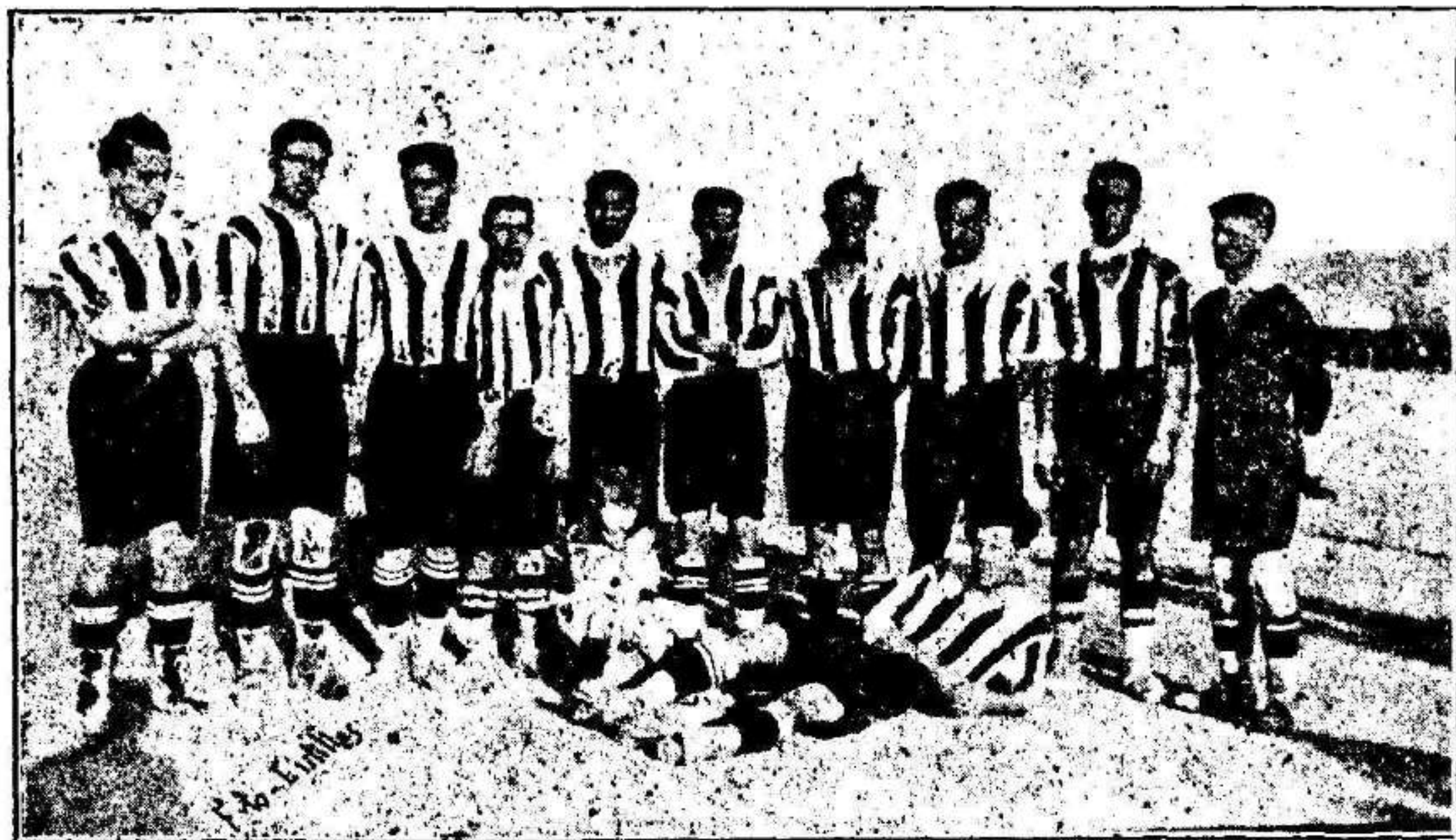
El primer equipo del Athletic Club Jumilla, que ha vencido al Racig de Almansa por 3 goals a 0

go que recordarle a mi amigo, que por lo visto es flaco de memoria, una de las condiciones del celeberrimo pliego: Francismo René no podrá jugar con el River más partidos que los de campeonato y en ningún otro pnesto que el de medio centro, cediéndolo al Ovalo para los demás partidos, y pasando a dicho club automáticamente (es un muñeco de cartón movido a cuerda el señor René) en el momento que termine el campeonato. ¿Es beneficiosa para el Ovalo esta condición?