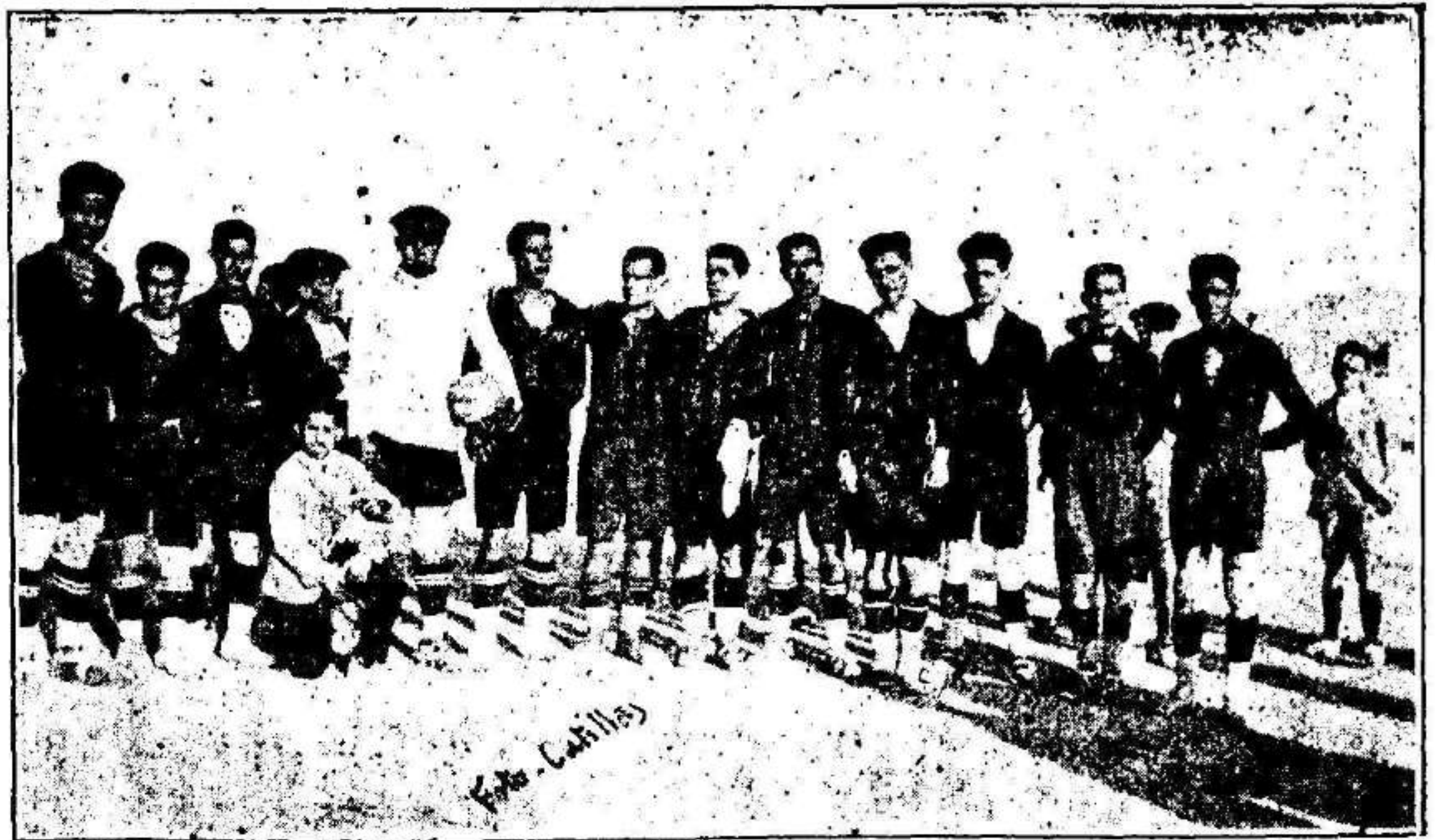
El potente equipo Racing Club de Almansa, que ha empatado con el Sport y ha sido vencido por el Athletic de Jumilla

Lea V. el próximo número de Murcia Deportiva