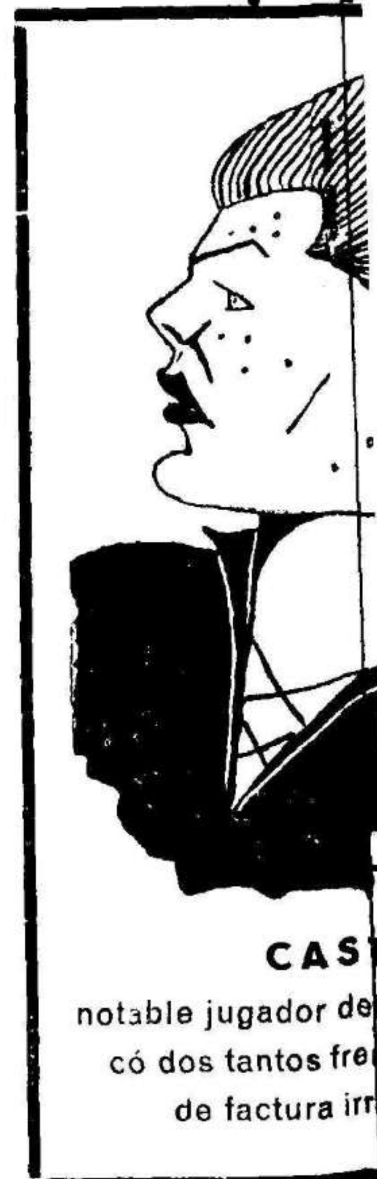
CAST notable jugador de có dos tantos fren de factura irre

En Torrevieja había mucha animación por presenciar los partidos anunciados, y buena prueba de ello fueron las entradas de las dos tardes. El Real