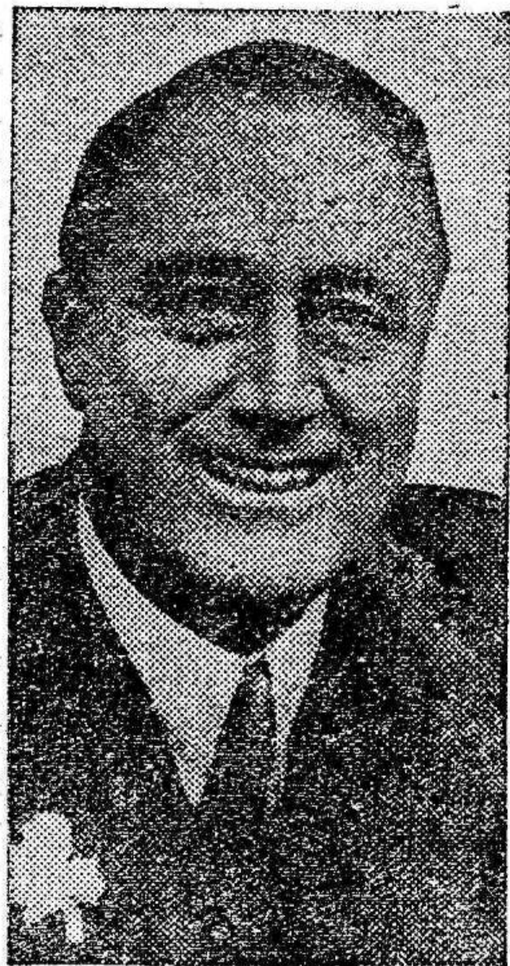
El presidente Roosevelt

Terminó Roosevelt su magnífico discurso declarando: “La guerra es contagiosa, sea declarada o no. Engloba a pueblos y naciones en el teatro de las hostilidades, y aunque nosotros estemos resueltos a apartarnos de ella, no podemos evitar sus desastrosos efectos sin peligro de ser mezclados en la contienda. Debemos adoptar medidas para resol-