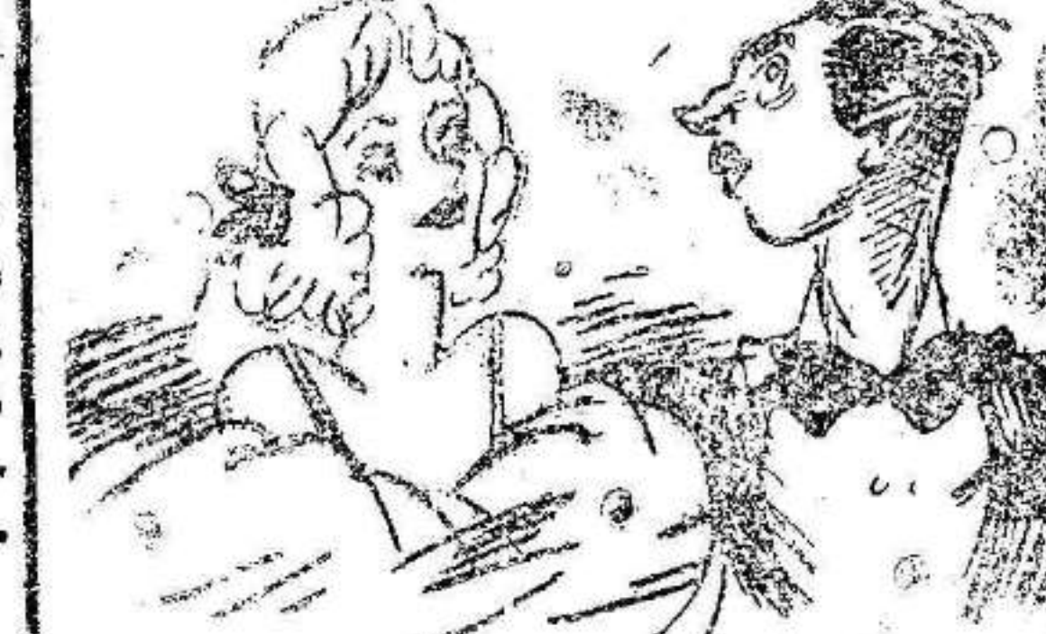
Ella.—¿Cuáles son los diez años mejores de la mujer? El.—De veintiocho a treinta.