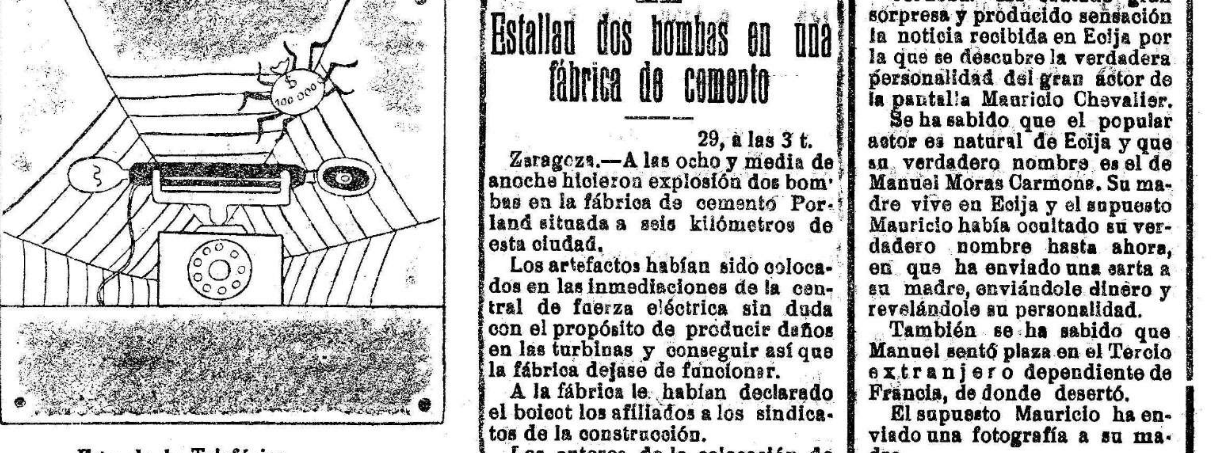
Esto de la Telefónica va siendo una cuestión crónica.