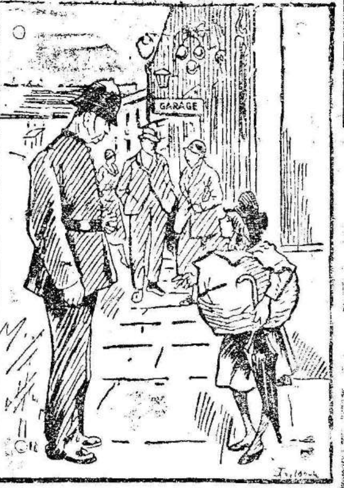
—Diga usted, guardia: ¿es ésta la segunda calle a la derecha?