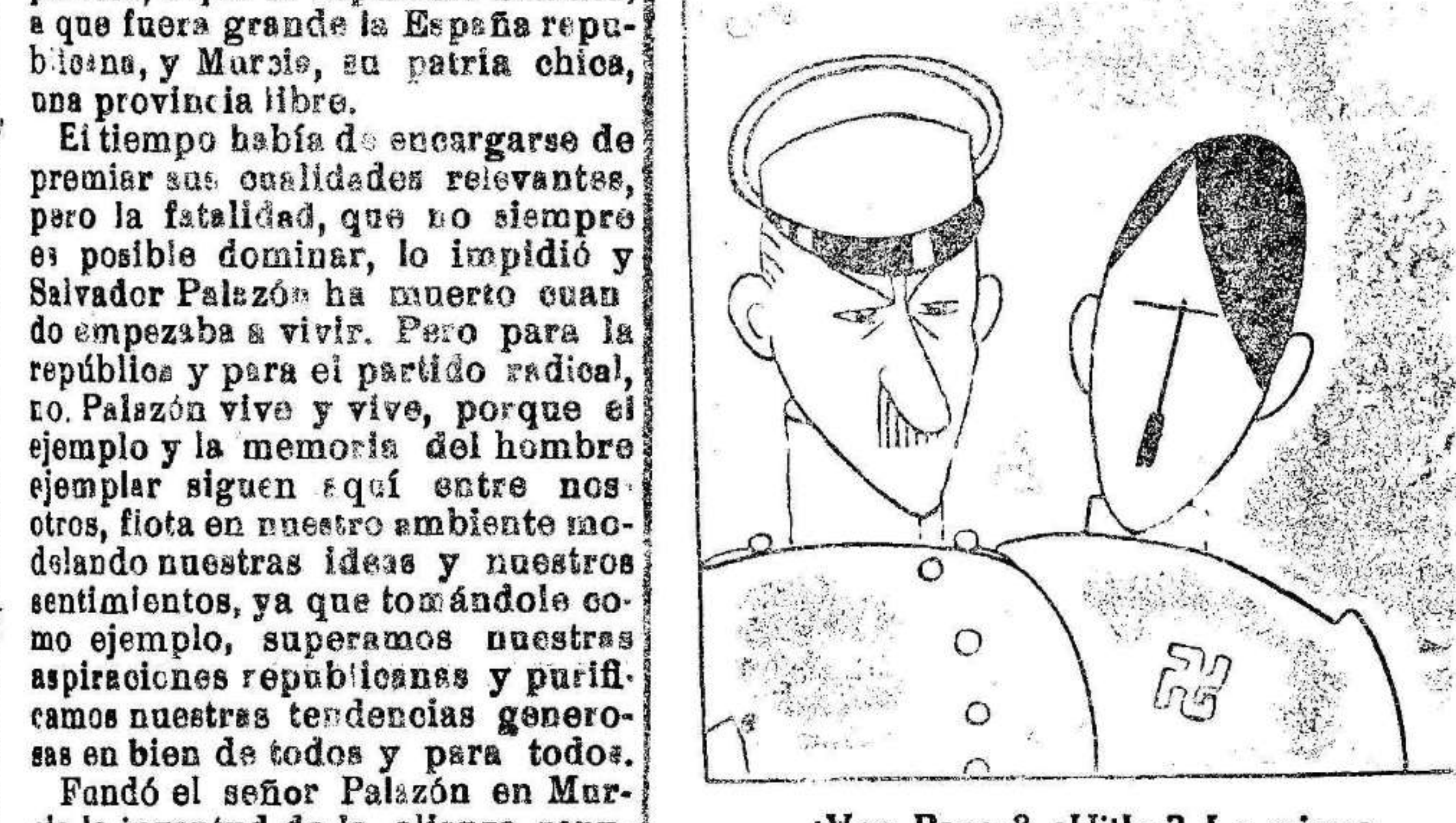
¿Von Papen? ¿Hitler? Lo mismo. Es todo militarismo.