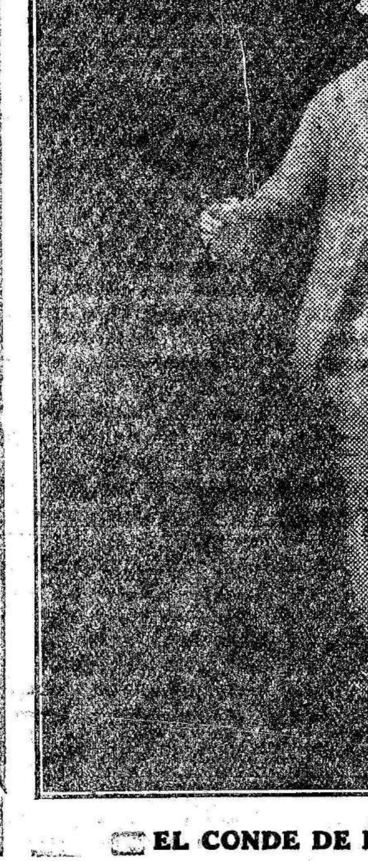
EL CONDE DE FLORIDABLANCA