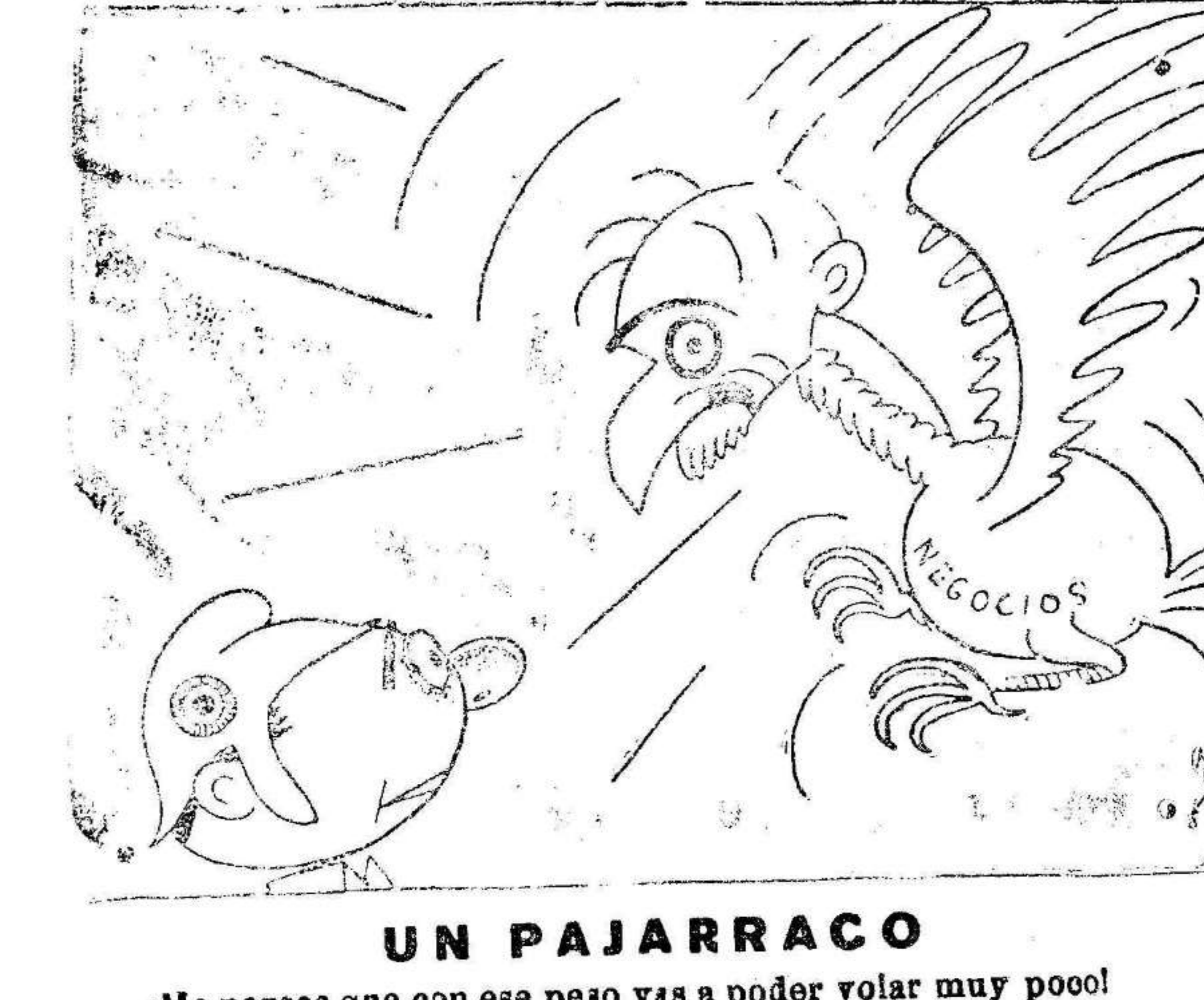
UN PAJARRACO —Me parece que con ese peso vas a poder volar muy poco!