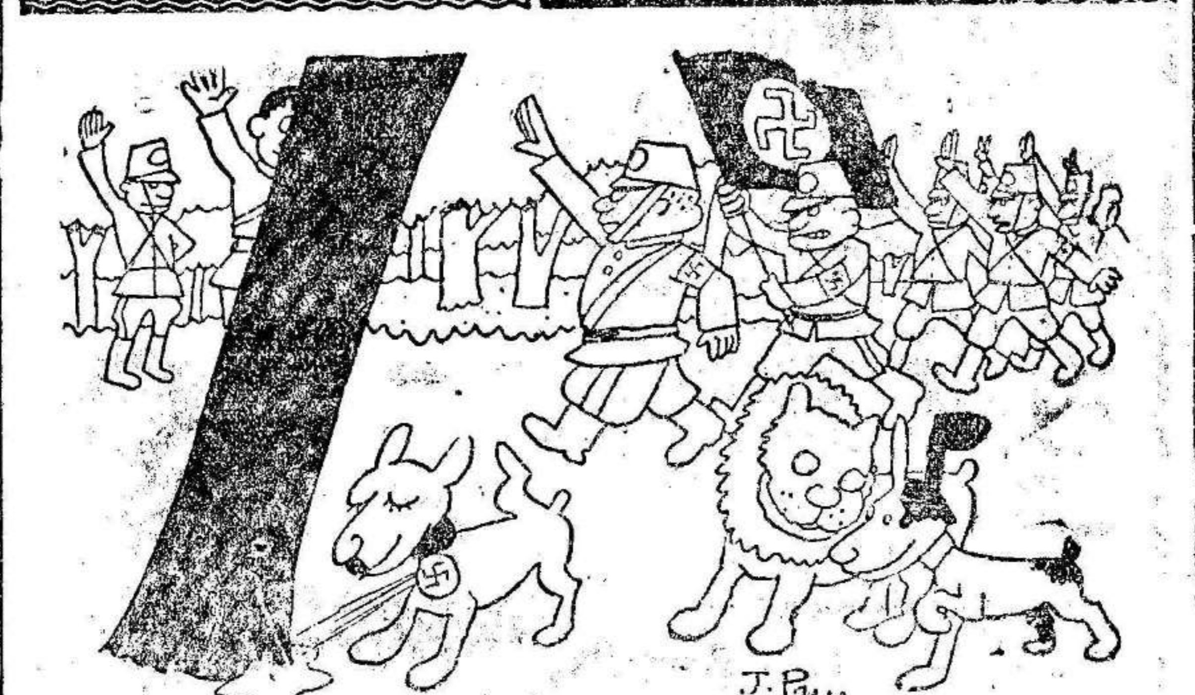
Otra vez las milicias hitlerianas —¡Hay que ver con qué aire levanta la pata! —¡C ray! ¡Es el perro de Hitler!

ganaría la gloria y la riqueza, alternando ese culto al arte literario con infinidad de viajes y estudios en el extranjero, encontró, decimos, en los más dispares horizontes el templo de su carácter y su rutina. África, Italia, Austria, etc.; animáronle a la labor superadora. En Inglaterra fué correspondal de un gran periódico berlinés. En Turquía estuvo, durante la gran guerra, bajo el fuego de los cañones aliados. En Norteamérica, donde sus libros merecerían tan gran acogida, pulsó la opinión de sus hombros más representativos. Y así, en todas partes, fué hallando el sentido humanístico de que rezuma toda su obra. Con «Regalos de la vida»—admirable título, denotador del recio optimismo, de la ponderación espiritual de Ludwig—ofrece el insigne escritor un como resumen de toda su ya vasta labor. El hombre se muestra tal y como es, y el escritor narra aspectos y circunstancias curiosos en torno a la creación de sus libros. En esa urdimbre va tejendo una trama pilloroma, de suma atracción y variedad, cuyos copiosos puntos no cabe ni aún reseñar aquí, siendo los principales esos retratos de personajes, los juicios sobre la Prensa y otras categorías de nuestro tiempo, su manera de escribir, las sugerencias en torno a los idiomas, su pasión admirativa hacia Goethe, la crónica de sus viajes, sus apreciaciones sobre el escritor y el editor, la odisea de la guerra, la vida en el exilio etc. Angel DOTOR