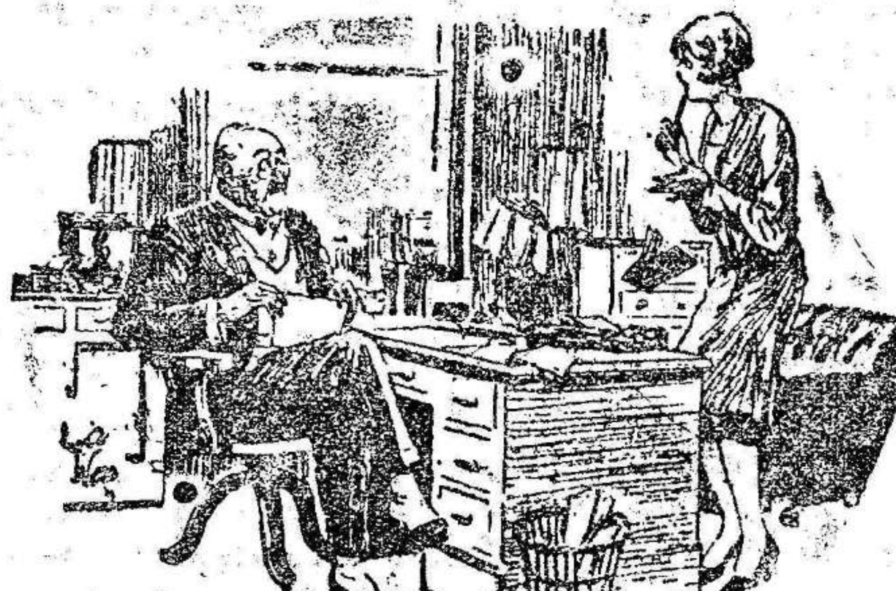
—Dado luego me es usted más útil que mi anterior secretaria. —Oh, muchas gracias! —Pero muchísimo menos útil de la que yo necesitó.