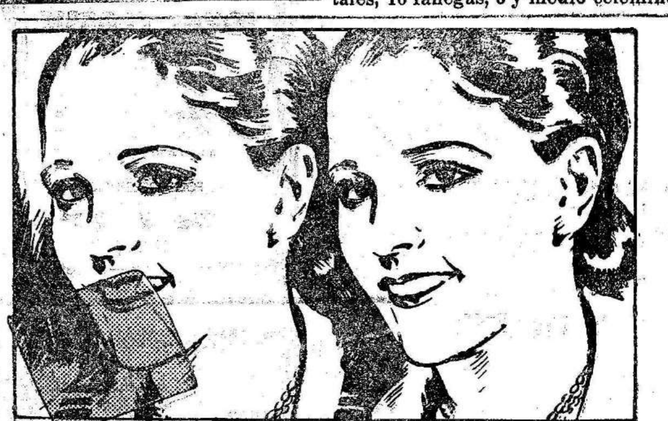
La película según la investigación odontológica altera el color natural de los dientes y provoca graves enfermedades en la dentadura. Debe cambiarse diariamente.