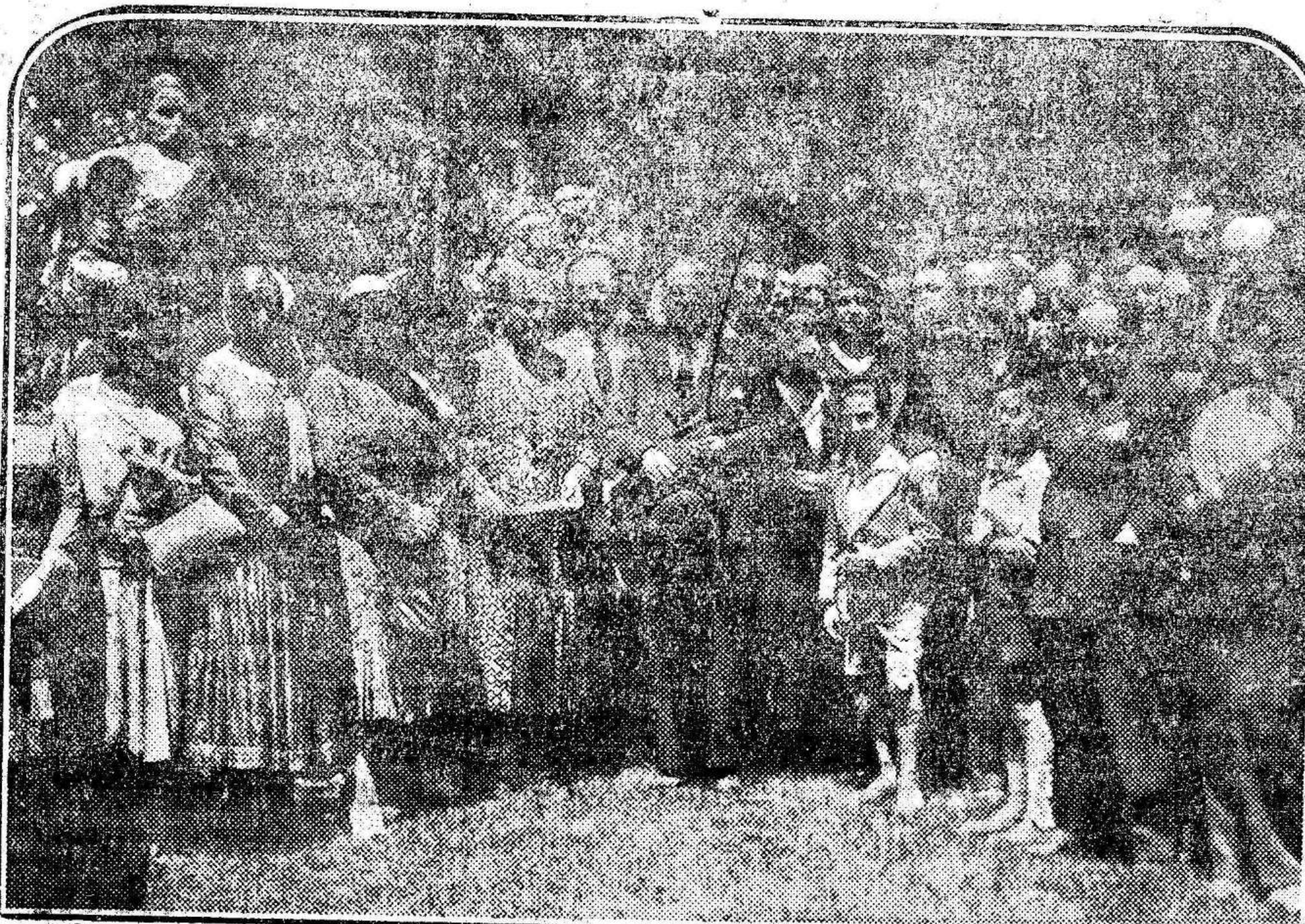
En el Retiro de Madrid y ante la estatua del autor de los «Episodios Nacionales», se ha celebrado un homenaje a la memoria de Galdós. Asistieron muchos autores, escritores y artistas, así como la hija, nietos y sobrinos del inolvidable escritor. Federico Oliver pronunció sentidas frases de amor a Galdós y su obra admirable, y los hermanos Quintero enviaron un telegrama de adhesión, que se leyó en dicho acto.

La Sociedad de Autores rinde homenaje a la memoria de Galdós