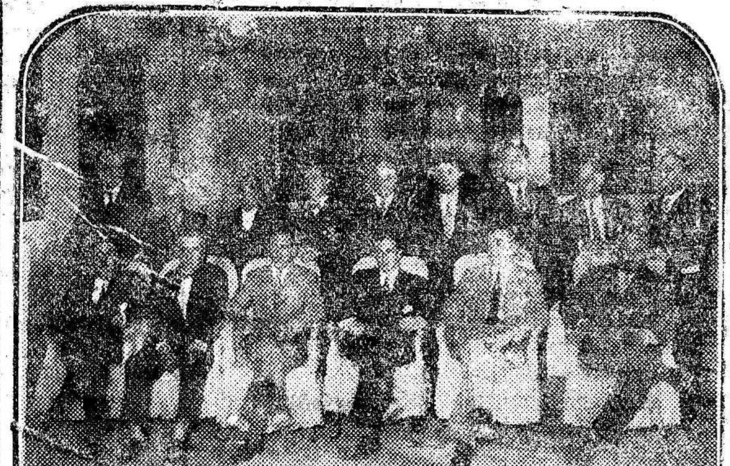
La Asamblea republicana de Salamanca para la aprobación del Estatuto Vasco.

30, a las 5 t. Salamanca.—Reina gran efervescencia entre los elementos agrarios a consecuencia del resultado de las elecciones. De los cinco candidatos que formaban la coalición republicano-socialista, tres han salido derrotados debido a las artimañas de los elementos agrarios. Se ha descubierto que estos a algunos pueblos, donde sabían que no los iban a votar, se an volcado los censos enteros, consiguiendo así la mayoría. Ante los procedimientos de que se han valido estos elementos para triunfar, la Federación