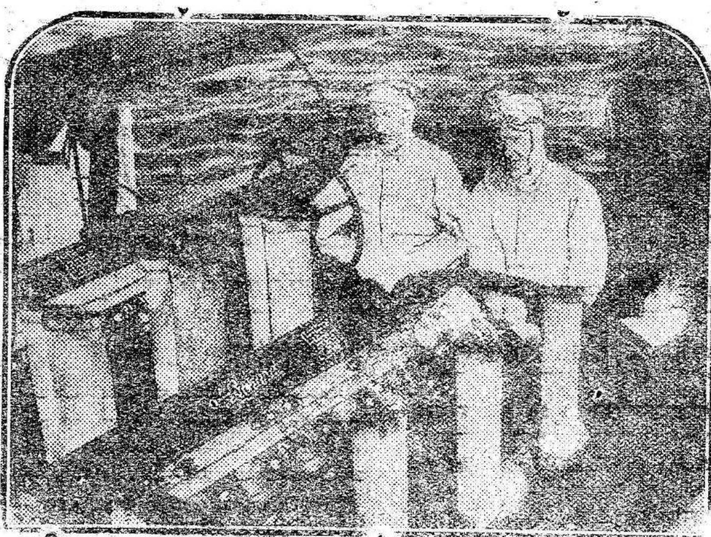
GAR WOOD, EL VENCEDOR DE SEGRAVE.—Murió Segrave y con él se fué aquél record establecido en el lago de Wüdemere. Record de velocidad sobre el agua. Pero ha venido Gar Wood a batir al hombre que se fué entre el vértigo de la rapidez... El record ha sido ganado. Gar Wood venció. Y no se fué al fondo del lago. Ciento setenta y dos kilómetros a la hora en Miami-Beach. Bonita marca.

La clave de la situación del Murcia, está en el partido del domingo contra el Coruña, que se ve muy precisado, ante el temor de resultados anormales. El normal, daría un poco de tranquilidad a los seguidores del Murcia, para los que se ha vuelto a abrir el portón de la esperanza.