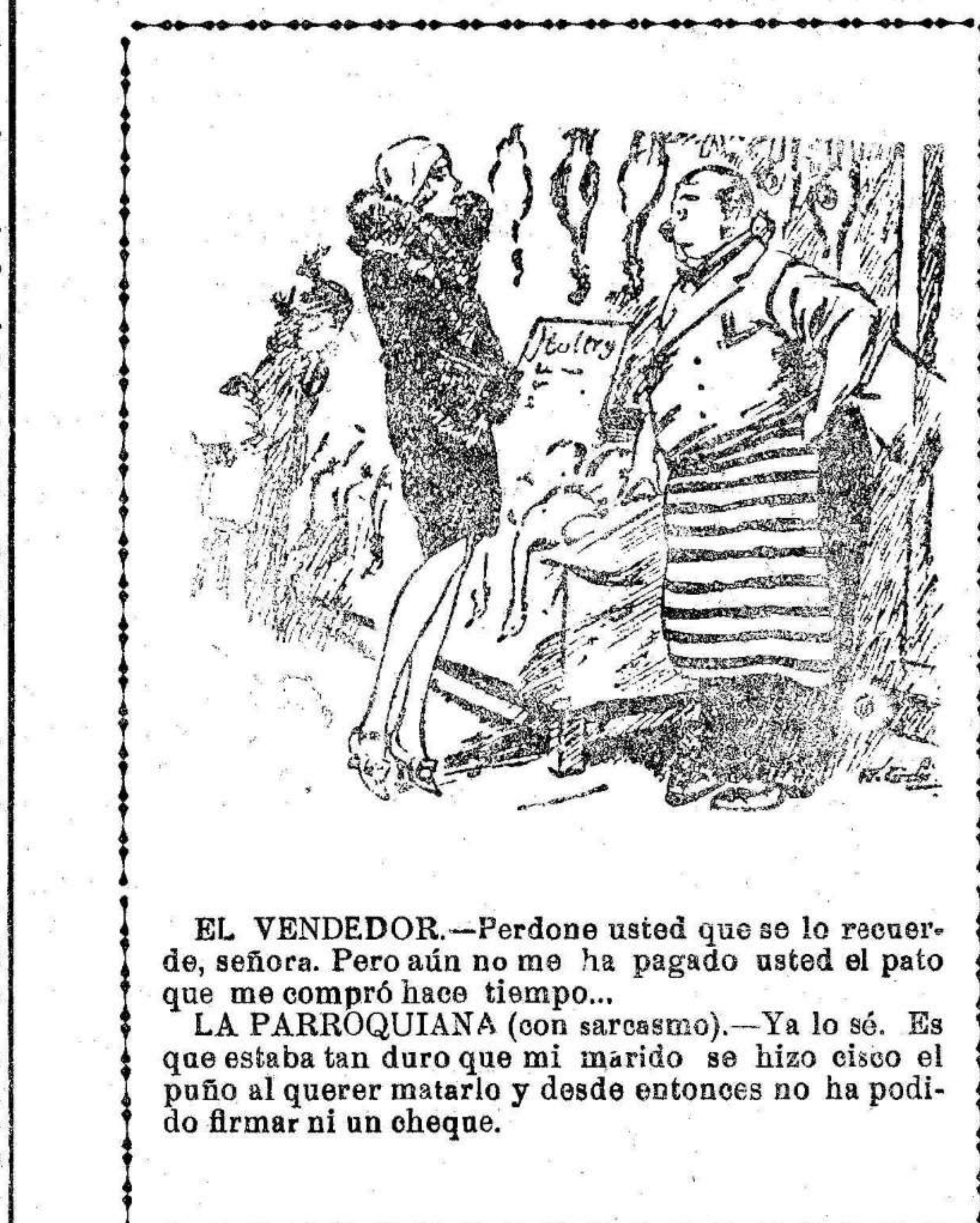
EL VENDEDOR.—Perdone usted que se lo recuerde, señora. Pero aún no me ha pagado usted el puto que me compró hace tiempo... LA PARROQUIANA (con sarcasmo).—Ya lo sé. Es que estaba tan duro que mi marido se hizo el cisco el puño al querer matarlo y desde entonces no ha podido firmar ni un cheque.

Suscríbese a EL LIBERAL DOS EDICIONES DIARIAS