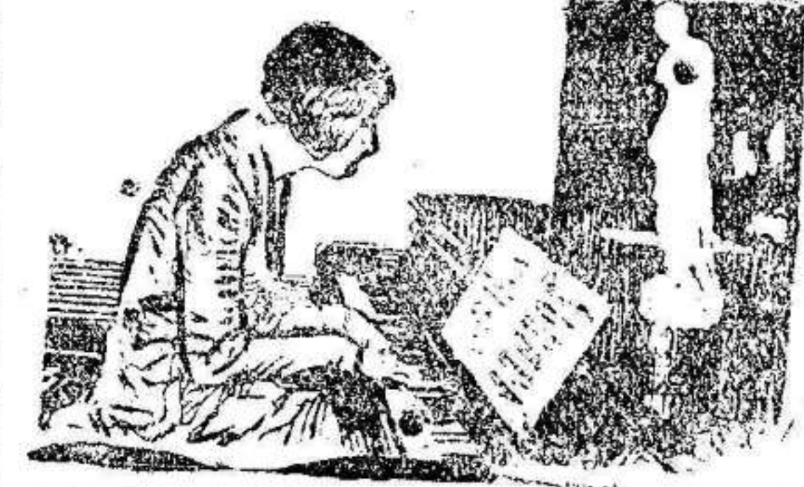
LA PIANISTA (Miranda a la Venus de Milo que está sobre el instrumento).—¡Qué suerte de mujer!...