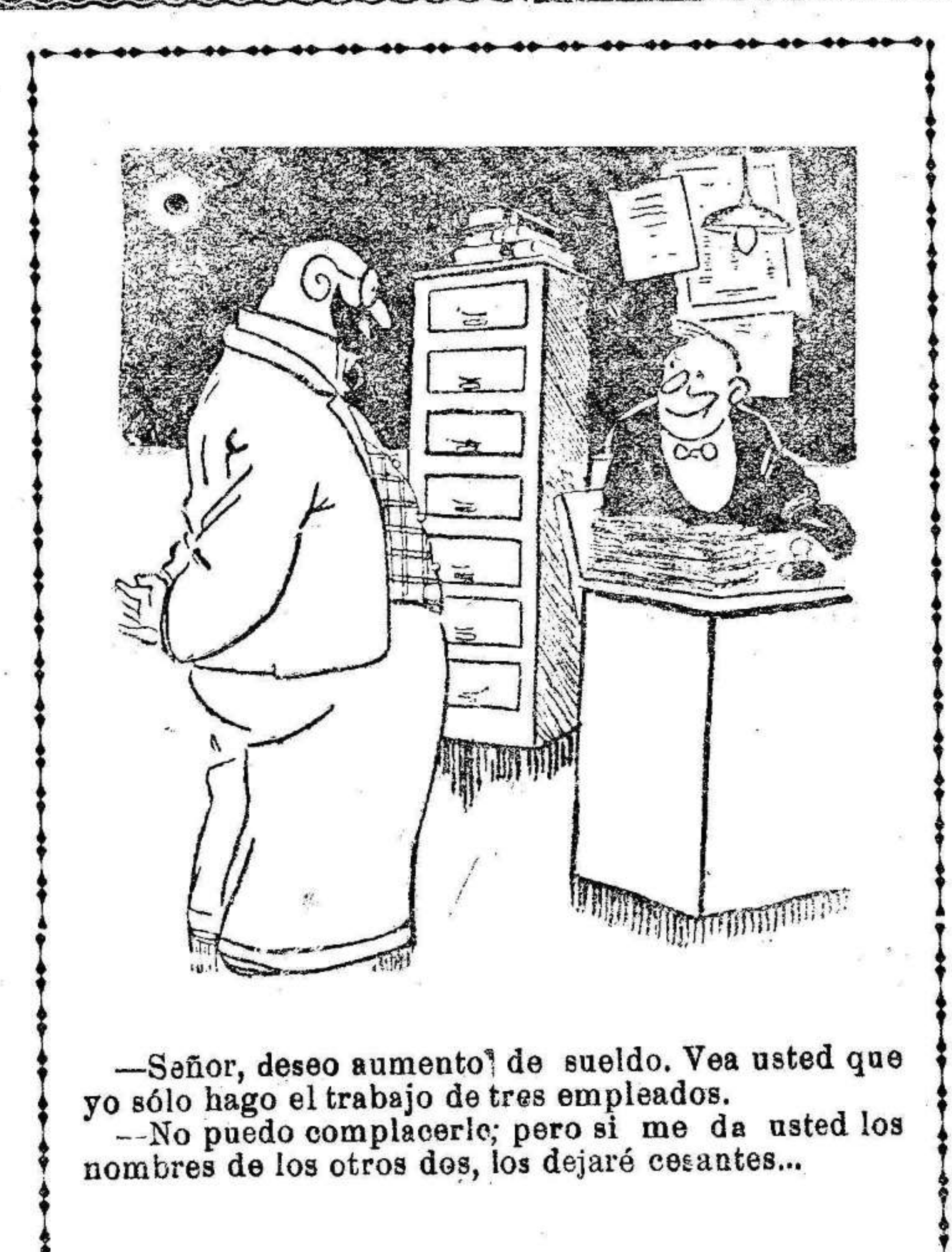
«Señor, deseo aumento de sueldo. Vea usted que yo sólo hago el trabajo de tres empleados.» «No puedo complacerle; pero si me da usted los nombres de los otros dos, los dejaré cesantes...»

Como los guardias no quisieron dejarle en libertad, los huelguistas cayeron sobre ellos, arrebatándoselo.