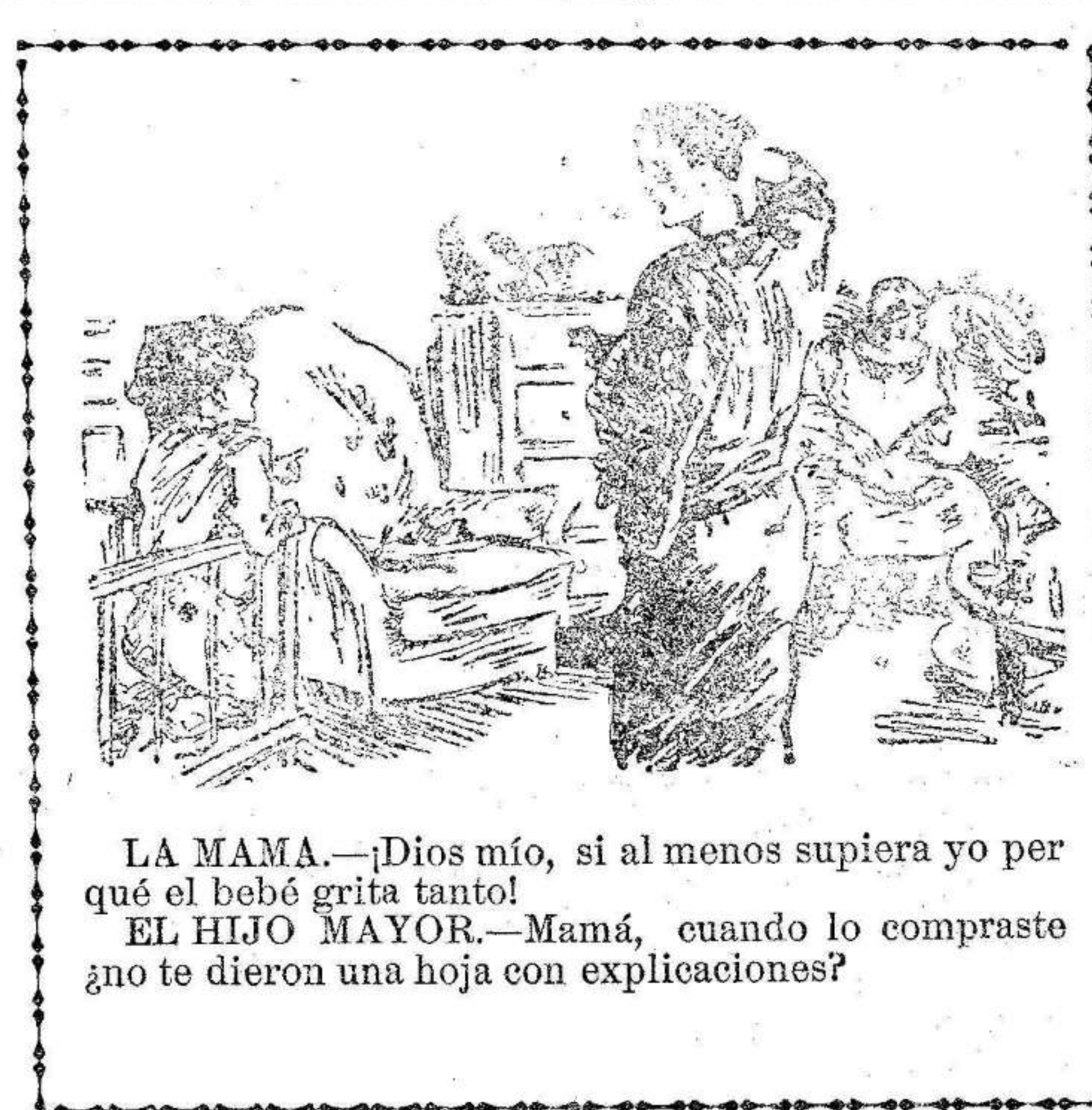
LA MAMA.—¡Dios mío, si al menos supiera yo por qué el bebé grita tanto! EL HIJO MAYOR.—Mamá, cuando lo compraste ¿no te dieron una hoja con explicaciones?

También podrán matricularse los alumnos no oficiales que tengan que examinarse durante la segunda quincena del mencionado mes de septiembre.