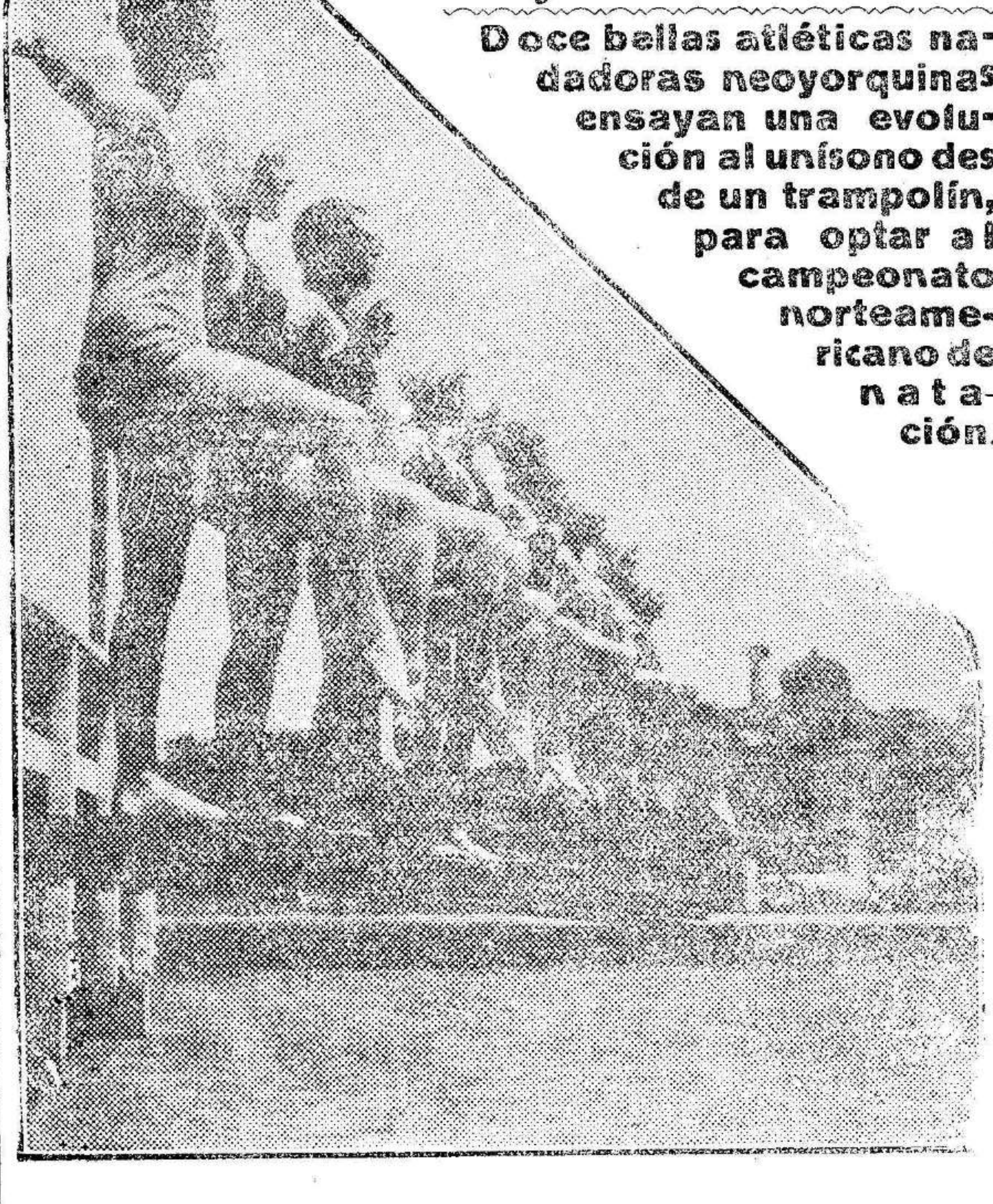
Doce bellas atléticas nadadoras neoyorquinas ensayan una evolución en un trampolín, para optar al campeonato norteamericano de natación.

«Las noticias recibidas acusan tranquilidad en toda España. En Gerona núcleo importante huelguistas ferroviarios Rivas, ha dado conformidad a concesiones ofrecidas Empresa. En Granada estacionada huelga mineros Alquife. En San Sebastián, retirándose trabajo obreros construcción Papelera del Carso y operarios perfumería Houbigant en Rentería. En Logroño anunciada huelga obreros meta- lúrgicos Casa Elías. En Murcia estacionada huelga esparteros Aguilas, Cleza Calasparra y una en Cae- gatin, la otra resuelta. En Tarragona huelga ladrilleros Reus estacionada y en Valladolid planteadas discrepancias entre obreros agrícolas y propietarios; de tres pueblos, han aceptado un laudo en dos de ellos.»