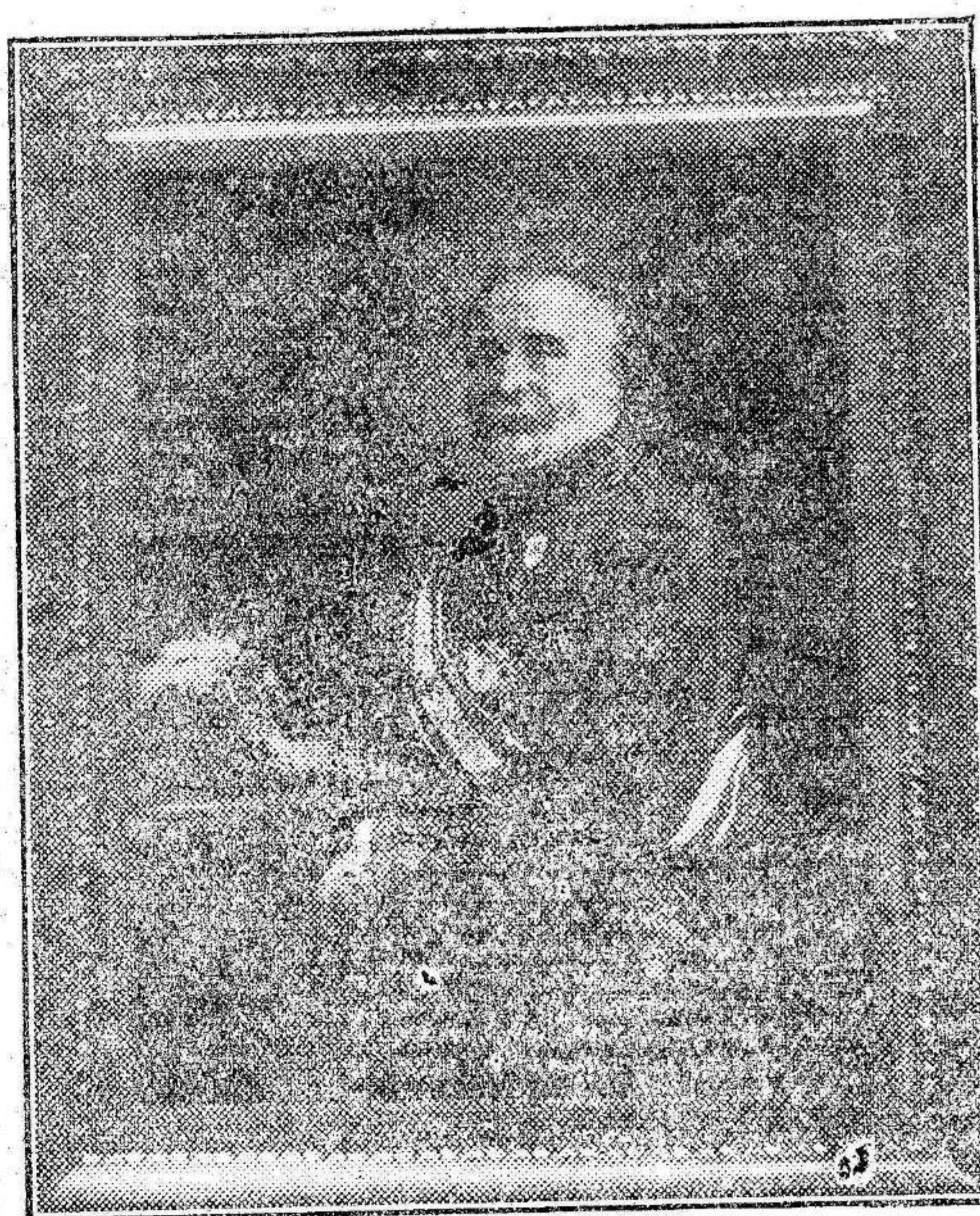
El exministro don Juan de la Cierva y Peñafiel, que ayer resultó herido en un accidente de automóvil

Durante su permanencia, habían acudido a saludarles y a interesarse por su estado numerosos amigos de Murcia y Cieza.