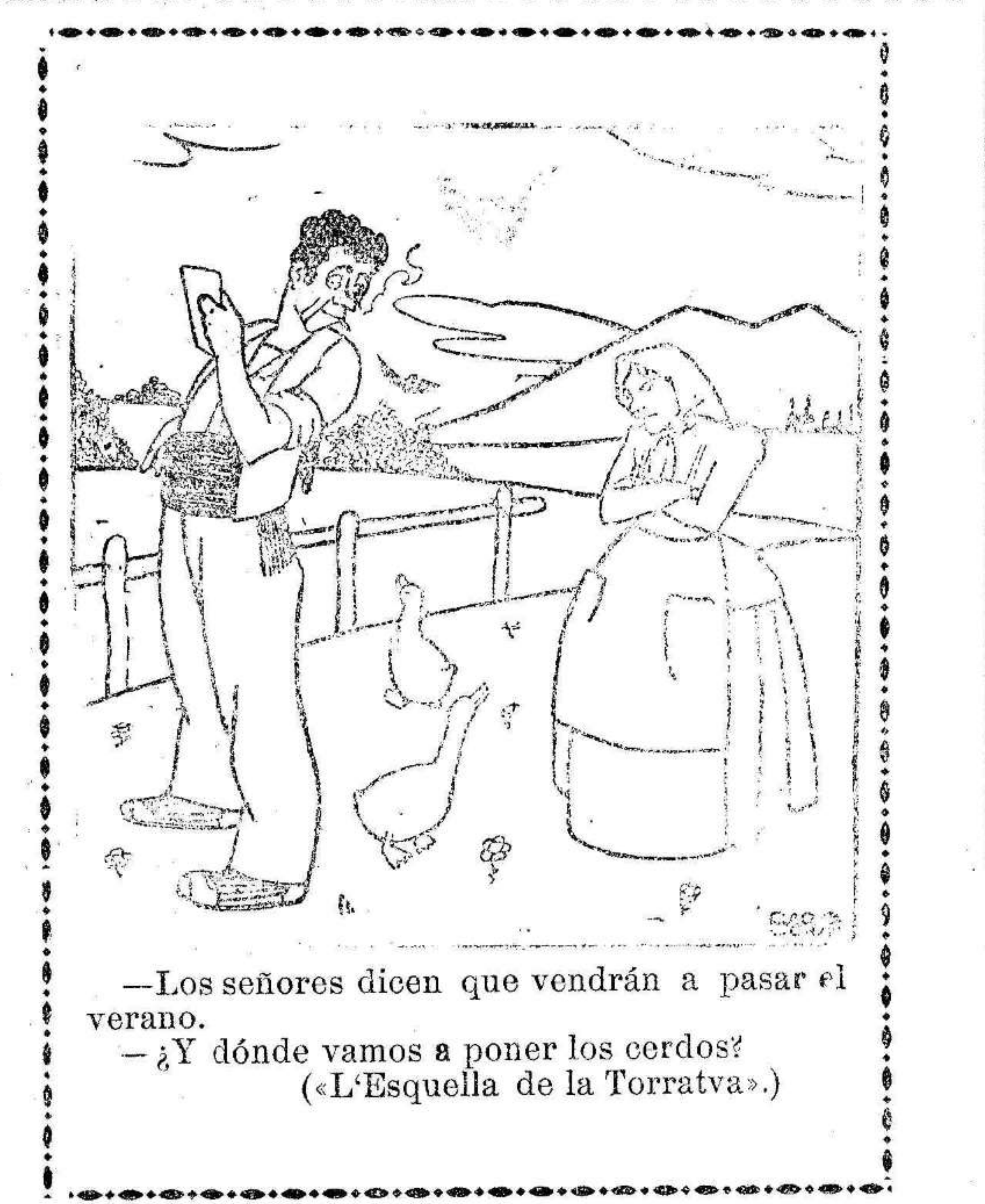
—Los señores dicen que vendrán a pasar el verano. —¿Y dónde vamos a poner los cerdos? («L'Esquella de la Torratva».)