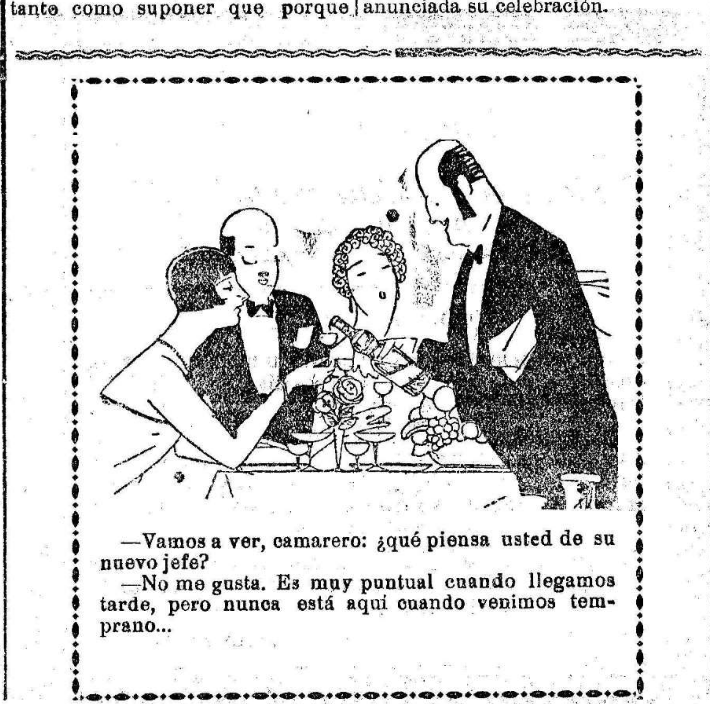
—Vamos a ver, camarero: ¿qué piensa usted de su nuevo jefe? —No me gusta. Es muy puntual cuando llegamos tarde, pero nunca está aquí cuando venimos temprano...

El presidente de la Sociedad Blanco y Negro, de Elche, nos ruega hagamos saber a los interesados en el Certamen Fiesta de la Poesía que estaba anunciado para el pasado domingo día primero de Junio que por causas ajenas a su voluntad ha tenido que ser aplazado y que tan pronto desapareciera el motivo será anunciada su celebración.