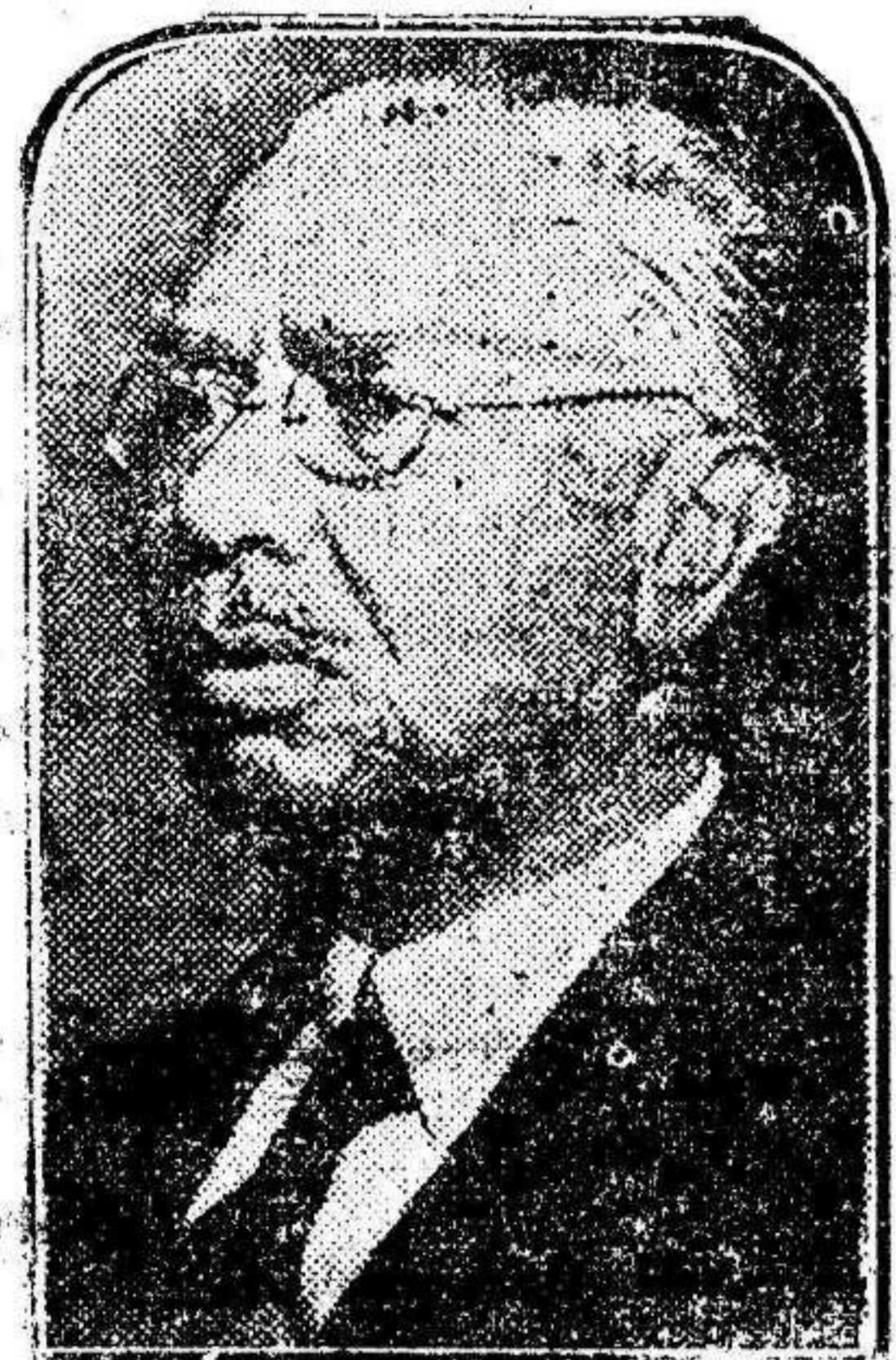
ORTIZ RUBIO El nuevo presidente de Méjico.

Méjico acaba de ofrecernos el ejemplo de sus elecciones. El pueblo, en la plenitud de sus derechos civiles, ha designado la persona que ha de ocupar, según la Constitución, la presidencia de la República. No recibe esta persona la más alta magistratura del Estado por herencia ni por gracia de Dios.