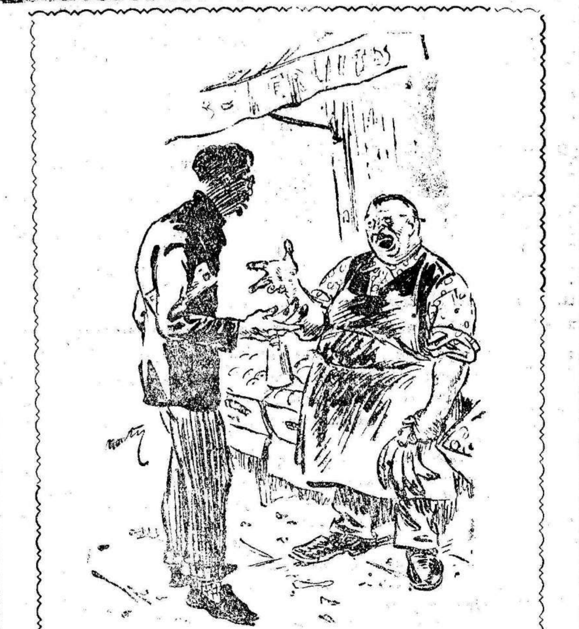
—¿A 7 perras lep látano?... ¡Pero si ayer estaba a 4! —Sí, pero es que mi mujer y yo hemos decidido ir a veranear a Deauville. (Le Rire.)