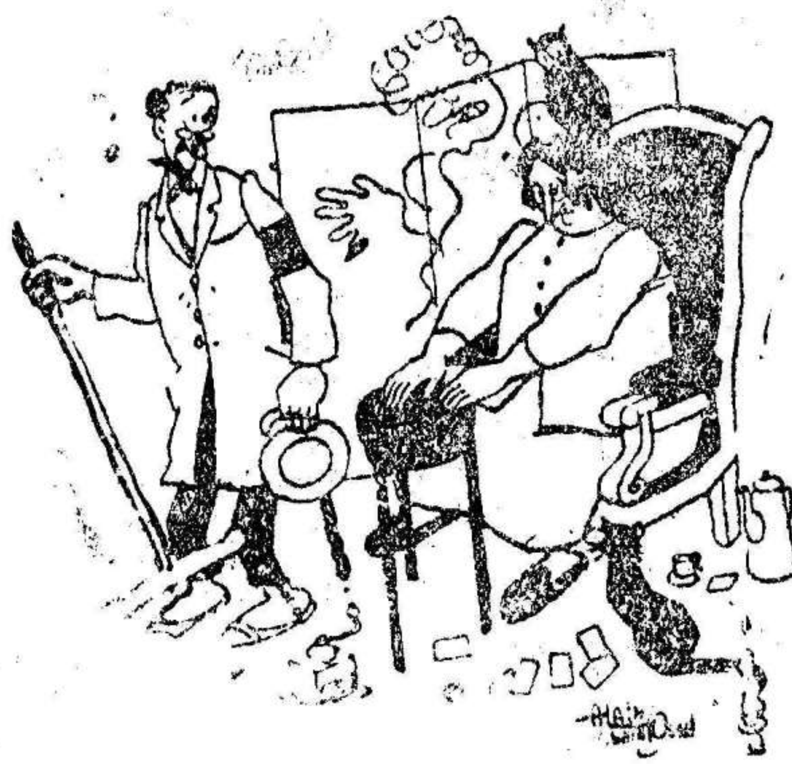
LA ADIVINADORA.—Ahí está el espíritu de su difunta esposa... Siento cómo se va materializando. EL CLIENTE VIUDO.—¿Sí? ¿Quiere usted tener la bondad de esperar un segundo, que voy a esconder este escobón?