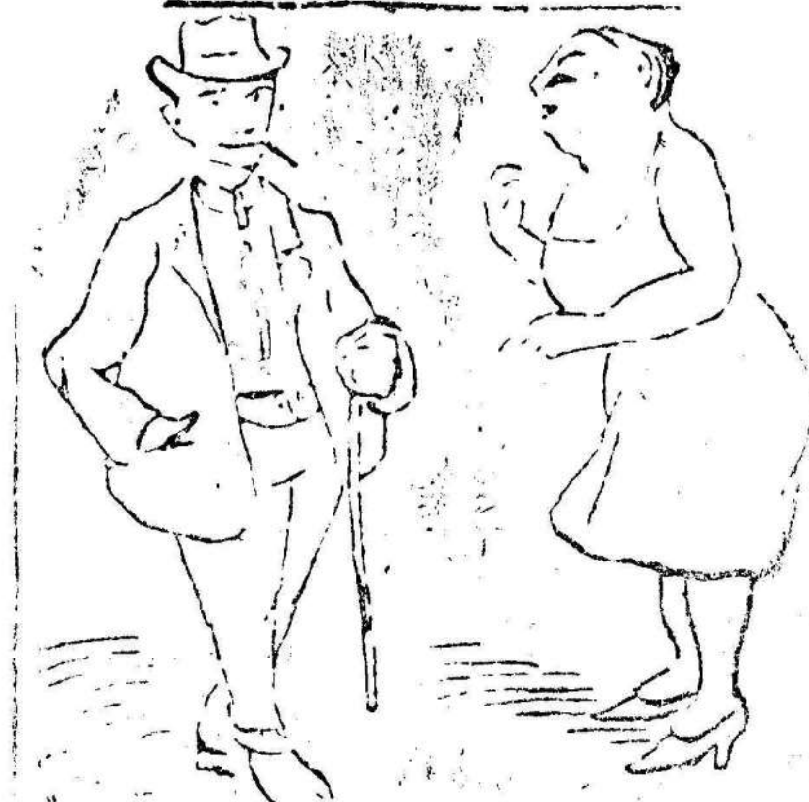
—Eres un hombre que no vale nada. —Y pensar que tú eres mi mitad..