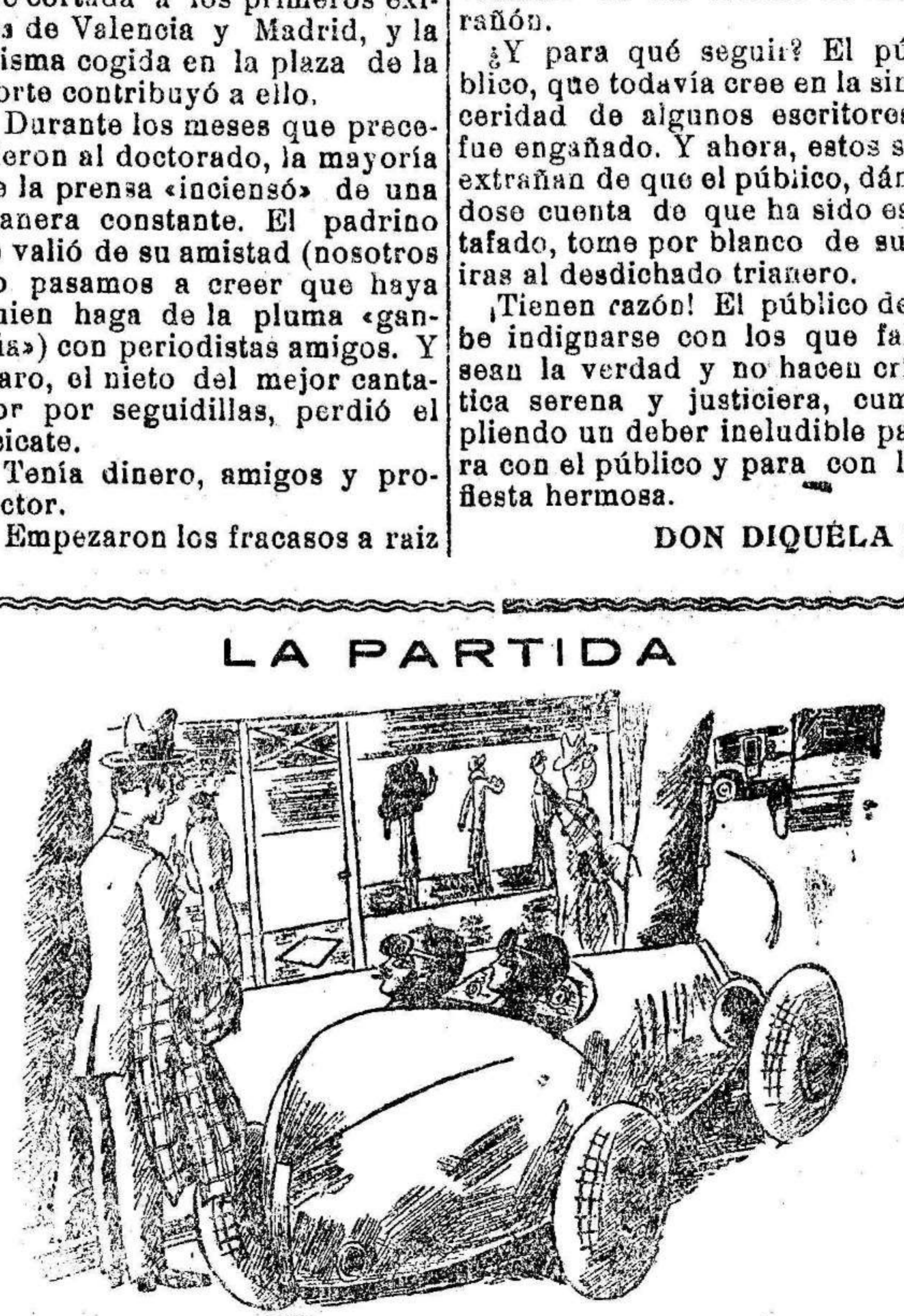
—Bueno, hijos míos, tened cuidado de no hacer correr dema- siada sangre al principio.