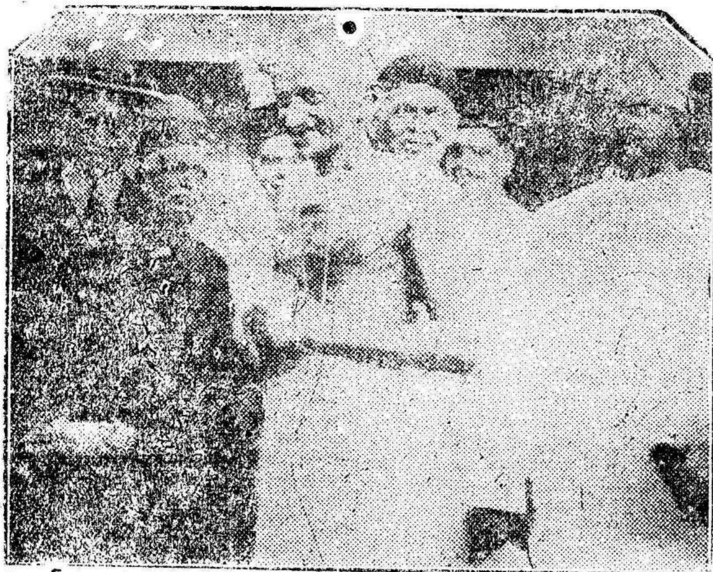
El líder nacionalista indio, Mahatma Gandhi, y su correligionario, el doctor Roy, que, detenidos y libertados poco después, a consecuencia de una manifestación tumultuosa, han reanunciado su ofensiva contra el imperialismo británico, defendiendo el boicot contra los comercian- tes ingleses.

El rescate de Riegos de Levante y Almadenes es asunto que sigue interesando grandemente a los elementos a quienes afecta. Después de la Asamblea de la Confederación sigue el asunto plan- teado casi en los mismos términos: ¿Conviene o no el rescate? ¿Lo quiere la Confederación? ¿Lo desean los agricultores? ¿Está la opinión con- forme con que la opinión se realice?