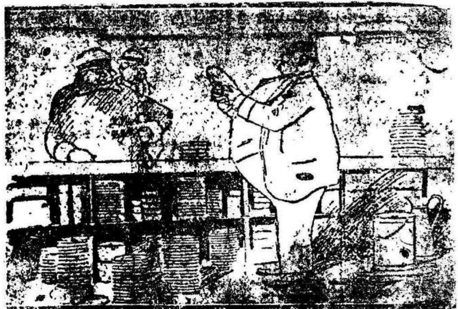
LA SEÑORA.—Platos para familia, ¿tiene usted? EL COMERCIANTE (al ver la catadura de la señora) —De esos de hierro esmaltado, ¿verdad? Son los más resistentes que tenemos...