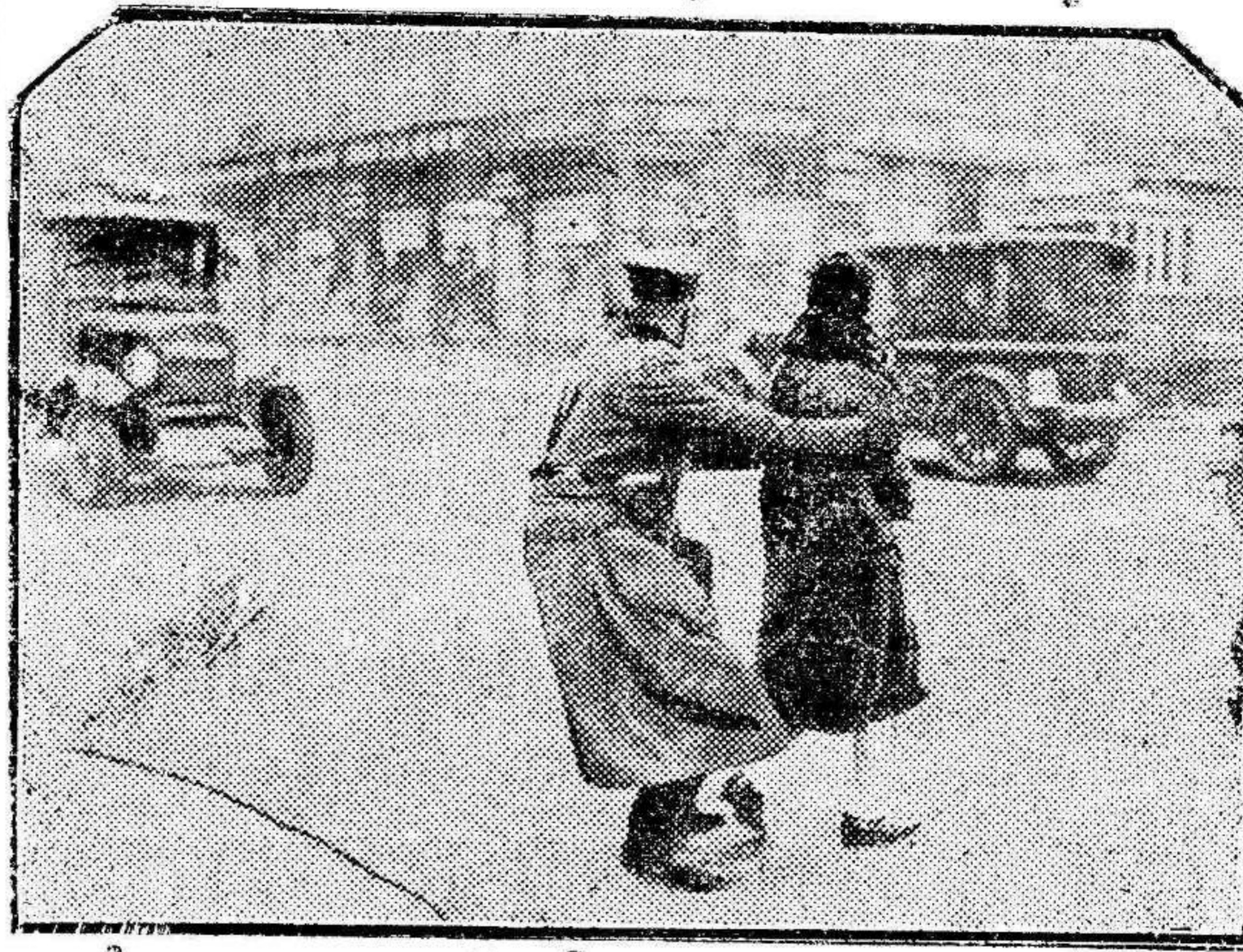
Los guardias alemanes de la "circulación son corteses, aunque esta fotografía parezca dar a entender lo contrario. No abrazan a las mujeres, ni las detienen con la misma violencia que si se tratara del carniceiro de Hannover, desuavizador de toda su familia. Este guardia berlinés y esta "gretchen" son sencillamente maestro y discípula. El urbano la enseña prácticamente todos los movimientos que ha de realizar para regular el tráfico el día en que le sea necesario practicarlos, vestida con gorra de plato y uniforme...