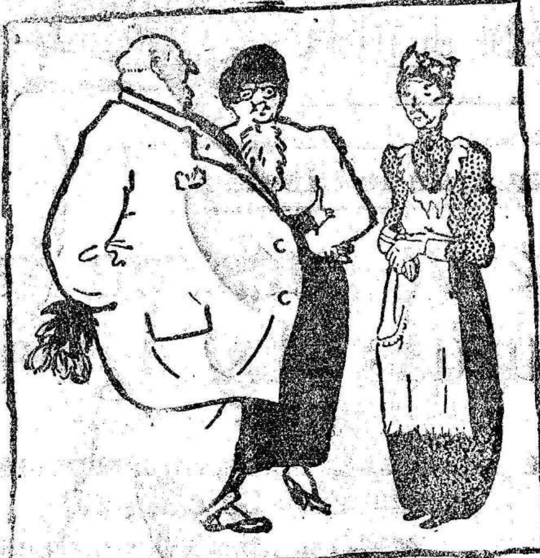
«Llevas veinte años a nuestro servicio y ha llegado la hora de que te consideremos como de la familia; desde el mes que viene no te daremos sueldo.» (La Región)