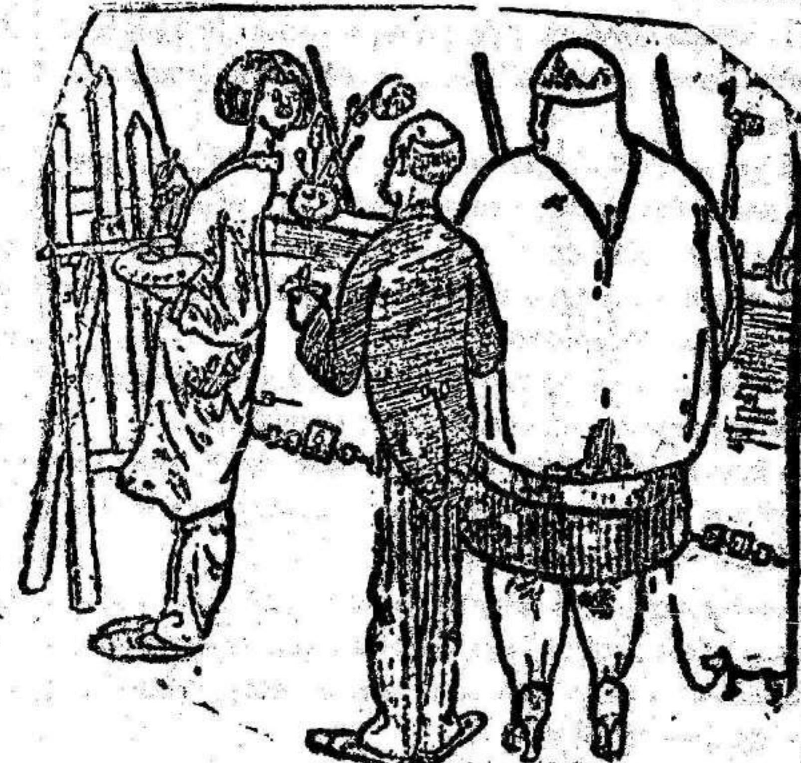
—¿Descan los señores...? —Un retrato de mi mujer en miniatura.