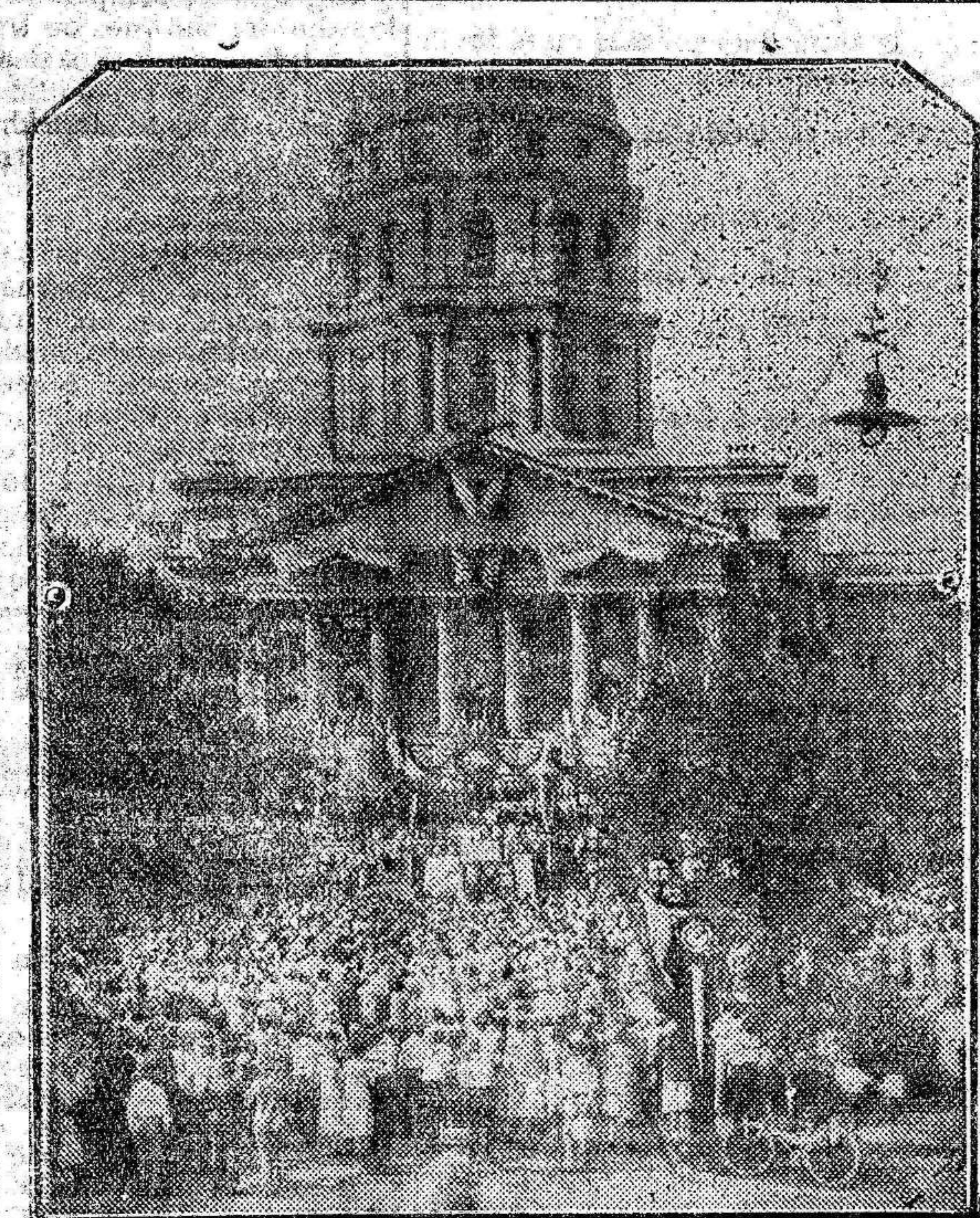
El candidato Herbert Hoover aclamado por sus admiradores antes de ser celebradas las elecciones que le han dado el triunfo.