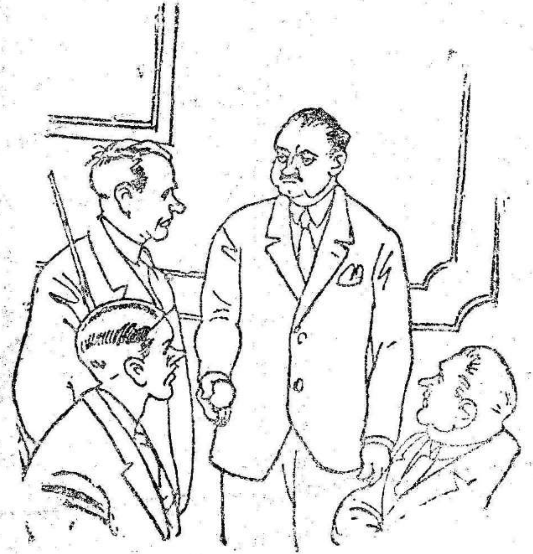
—Cada año, se necesitan dos mil electantes para fabricar bolas de billar.

—¡Parece mentira que a unos animales tan grandes se les pueda enseñar un trabajo tan delicado!