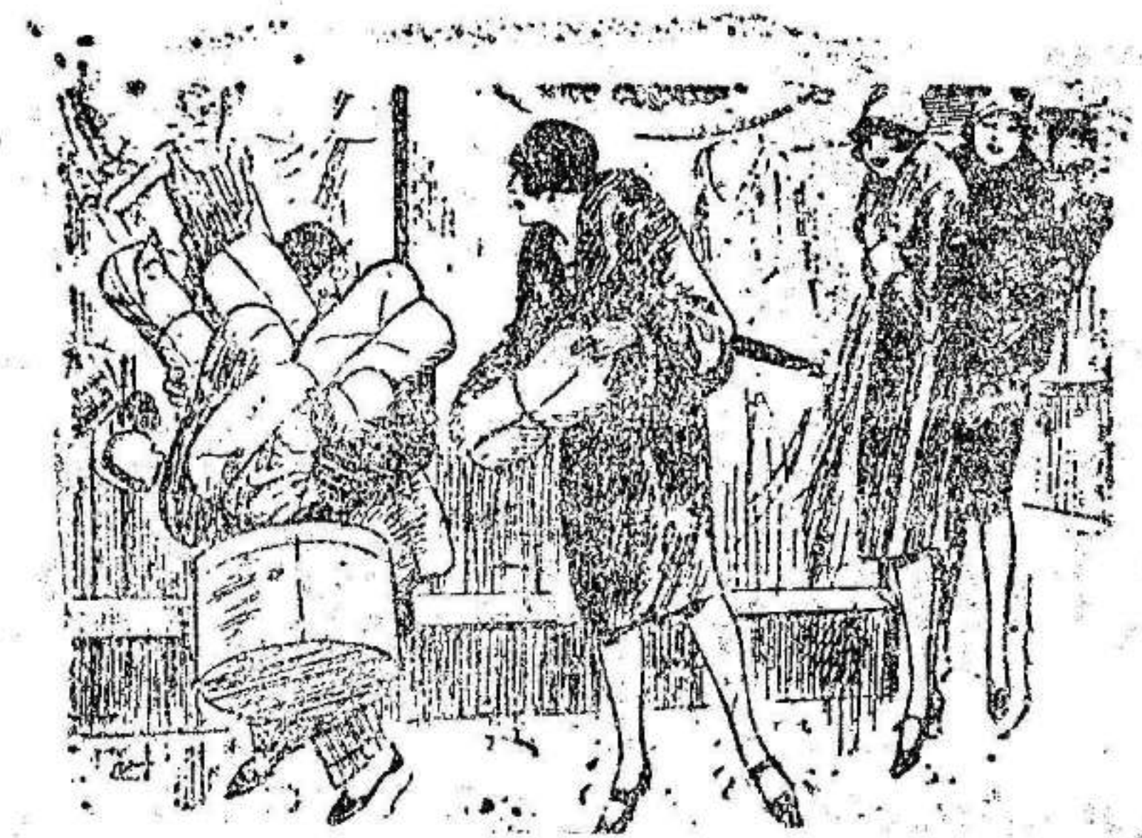
—Antes de atravesar la calle debes mirar a derecha e izquierda, no sea que te atropellen...