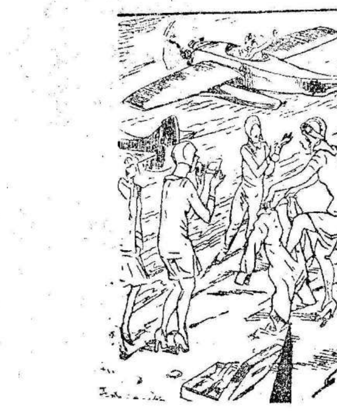
EL.—¡Ahora es cuando los maridos comenzaremos a sentir las ventajas de la aviación!