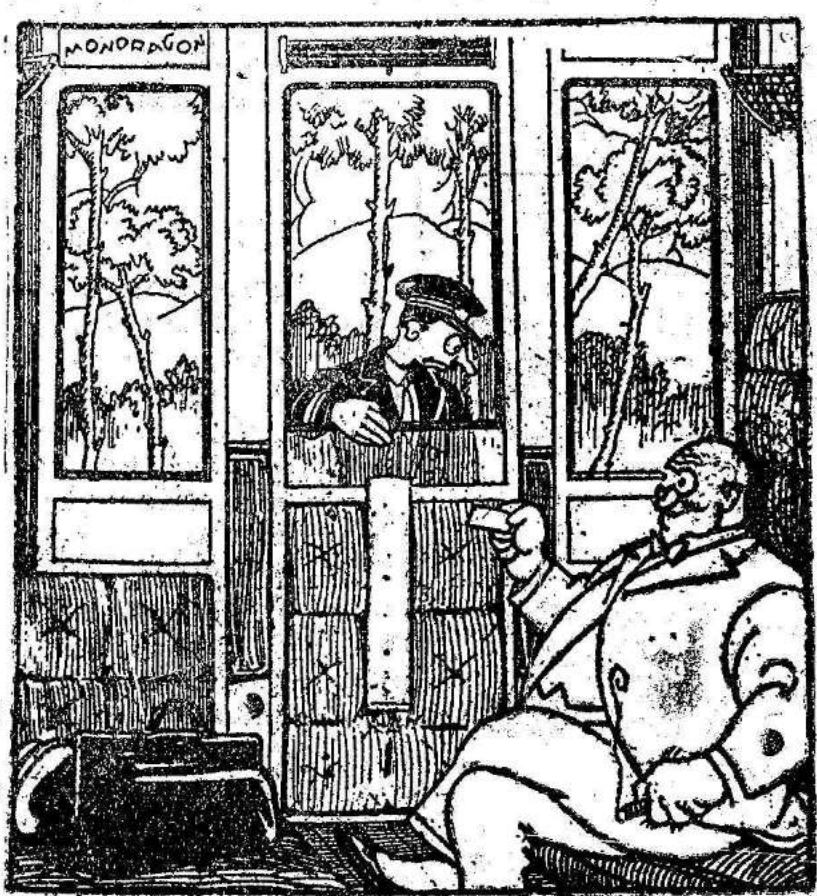
—Ese billete es de tercera. —Sí, señor. —Y cómo va usted aquí? —De primera.

Como está muy puesto en razón lo que solicitan, esperamos que el alcalde ordene al Presidente de la Comisión de Policía Urbana gire una visita de inspección a aquel sitio para que se entere del fundamento de la queja y complazca a los vecinos de la calle de la Proclamación.